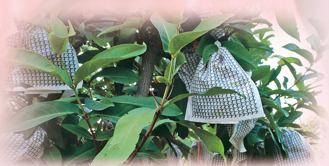
蓮霧在採收前一個半月的小果期，就已採用套袋來保護，食用安全。

消費者錯誤觀念：多認為蓮霧施用較多農藥。其實，蓮霧在採收前一個半月的小果期，就已採用套袋保護；套袋後幾乎不需再施用農藥，到採收時，套袋前所施用的農藥大多已分解，請消費者安心食用。另外，民眾可選購吉園圃或產銷履歷標章農產品，既安全又有保障。