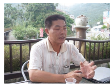
吳專員對華山地區熱心服務