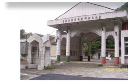
風災過後荒廢的猴硐國小