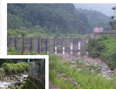
每逢颱風豪雨土石流 都威脅著社區