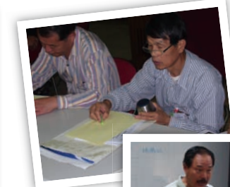
自畫像下第1筆是很重要的