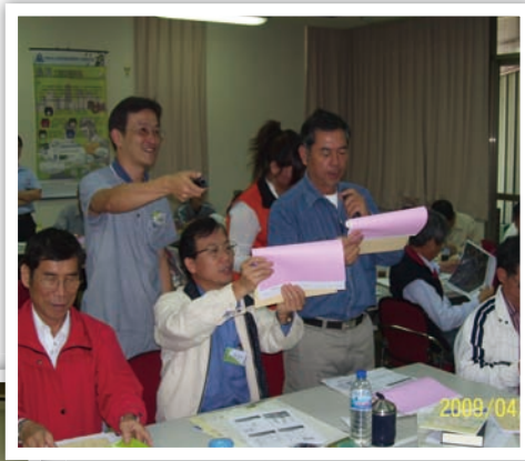
同學！看這裡！看這裡！