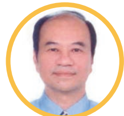
97F-0051 王仙入 回傳次數：32