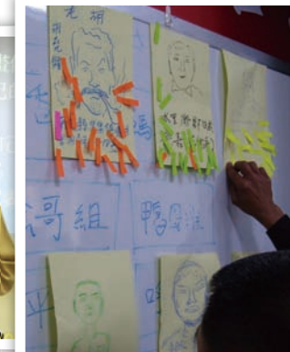
全民來公投！請惠賜一票，凍蒜！凍蒜！