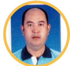
97M-0157 金馬嵐 回傳次數：34