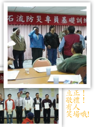
拿到結訓證書很有成就感