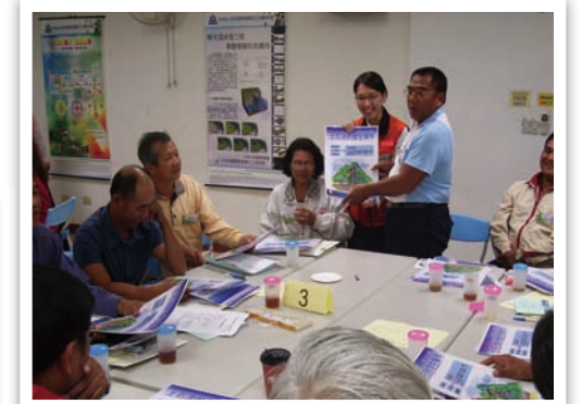
讓我告訴大家土石流發生的條件，要專心聽哦！