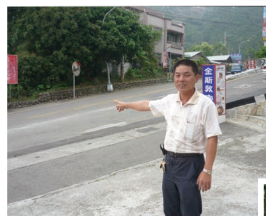
土石流曾經淹沒整個馬路