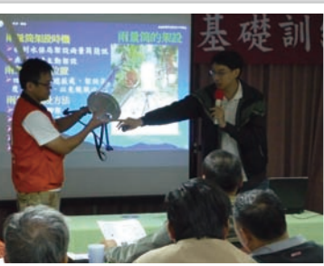
注意看哦！這就是雨量筒哦！