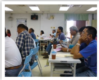
上課的時候這個姿勢還不錯

哇！這堂課看到幾個土石流災害的影片，真是驚心動魄。颱風期間水保局會成立應變小組，隨時監控各地，重視每位民眾的通報訊息，而土石流防災專員的任務之一就是協助回報災情，災情通報重點內容還有口訣哦，就是「人、事、時、地、物、現在」，你记住了嗎？