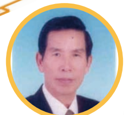
97F-0060 趙木 回傳次數：72