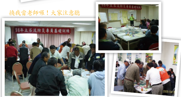
這是秘密會議不可以告訴別人哦！