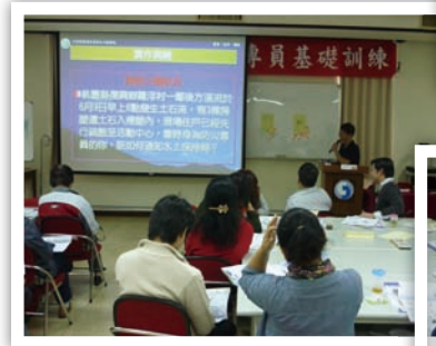
實作演練！大家準備接招囉！