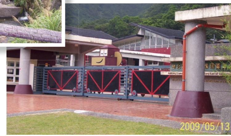
重新建設後美麗的猴硐國小