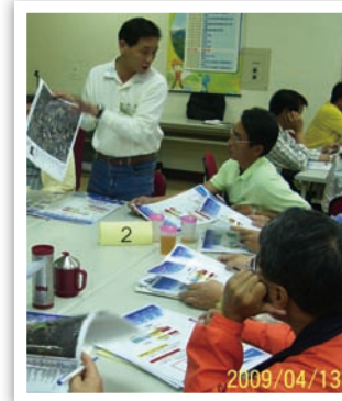
我們家就住在這裡啦！