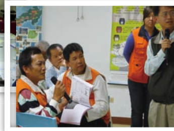
找不到答案，老師給個提示吧！