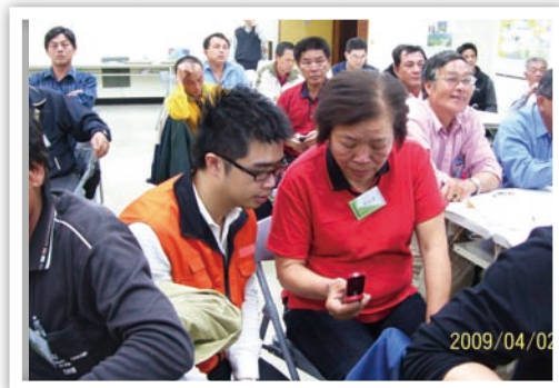
下一步是按哪裡呢？