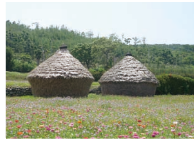
享受寧靜優雅的農村生活

目前台灣農村面臨人口外流與高齡化嚴重、基礎設施不足、發展緩慢、生活環境特色喪失，以及農村發展嚴重落後等課題，在廿一世紀全球化的發展趨勢下，這些問題更加嚴重，致使農村的邊緣化發展。針對這些缺失，馬總統「愛台十二項建設」之一，就是要推動農村再生計畫，強調地方賦權、尊重多元文化、落實地方居民參與及社區發展決策機制，同時也凝聚與動員農村社區能量，賦予農村自主的新型態關係，進而促進農村活化，提升農村整體發展。