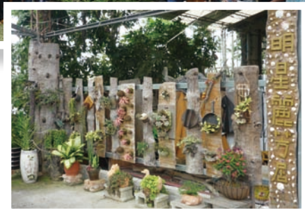
慶東社區居民自行綠美化家園，自取名字，每屋各有特色