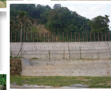
土石流發生後水土保持局所建之擋土牆