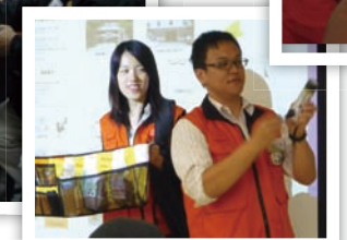
這位大哥，手電筒使用前要先搖一搖哦！