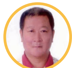
97M-0161 許杜金萬 回傳次數：38