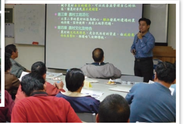
大家不要緊張，這些條例不用背起來