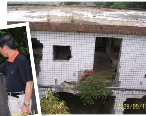
巨石挾帶大量泥砂衝入猴硐國小