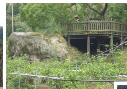
住戶於土石流後重建之房屋