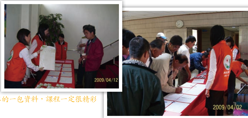
哇！好厚的一包資料，課程一定很精彩

我來報到囉！ 可愛的工作人員請告訴我要在哪裡簽下我的大名呢？ 哇！還有一大袋的資料要拿哦？