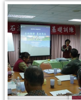
來參加專員就對了，好康報給你知

好康報給你知哦！馬總統「愛台十二項建設」之一，就是要推動農村再生計畫，可以增加地方居民參與及社區發展決策機制，同時也凝聚與動員農村社區能量，賦予農村自主的新型態關係，進而促進農村活化，提升農村整體發展。一起來參與農村再生計畫吧！