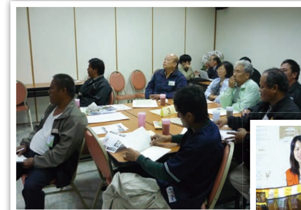
專員都很認真上課哦！

開始上課囉！先來介紹土石流防災專員的主要任務就是自主雨量觀測、災情通報、警戒訊息傳遞及協助疏散避難等，還有成立的目的，以及防災專員的權利和義務。