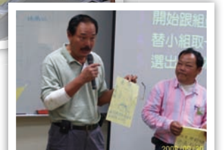
這是最自豪的自畫像