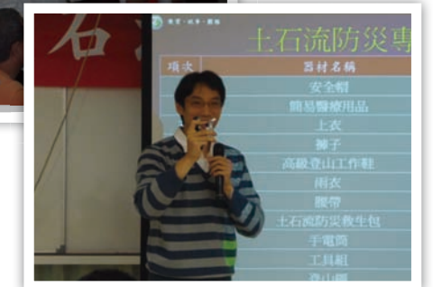
這就是傳說中神奇的打火機