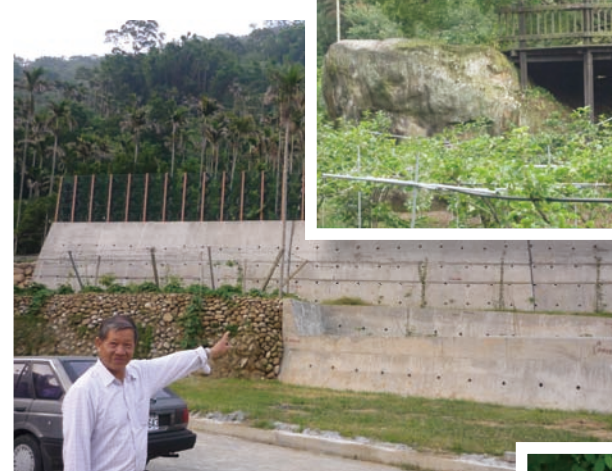
去年發生土石流淹到6戶住家