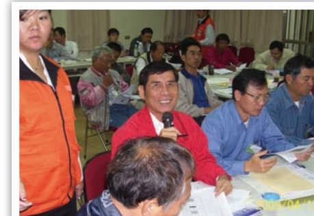
來上專員的課是件高興的事哦！