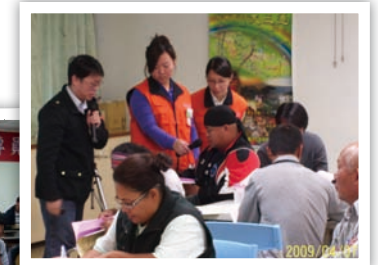
這麼多人看著，我會緊張耶！