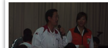
老師！你講得太好了！