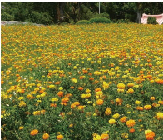
北埔社區萬壽菊陸續綻放