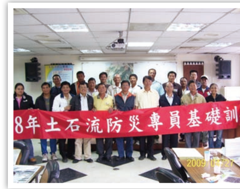
我們這一班結訓囉！