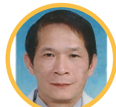
96M-0217 盧瑞院 回傳次數：59