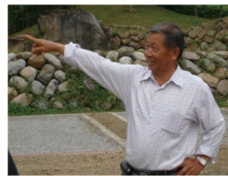
里長伯熱情投入慶福里的建設