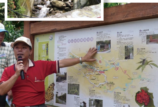
華山步道是風災後水土保持局協助建設的，使地方更具特色