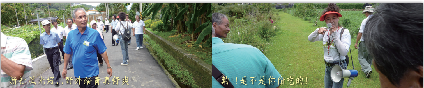
新社風光好..野外踏青真舒爽！

騎單車體驗新社馬力埔鄉間小路的田園風情，道路兩旁，隨著四季變換有著不同的果實累累攀附，不時會從遠方傳來花果飄香，分支的鄉間小巷，有著令人驚喜的異國風別緻民宿，來此喝杯下午茶也別有風味，是值得來一趟單車之旅的悠閒境地。