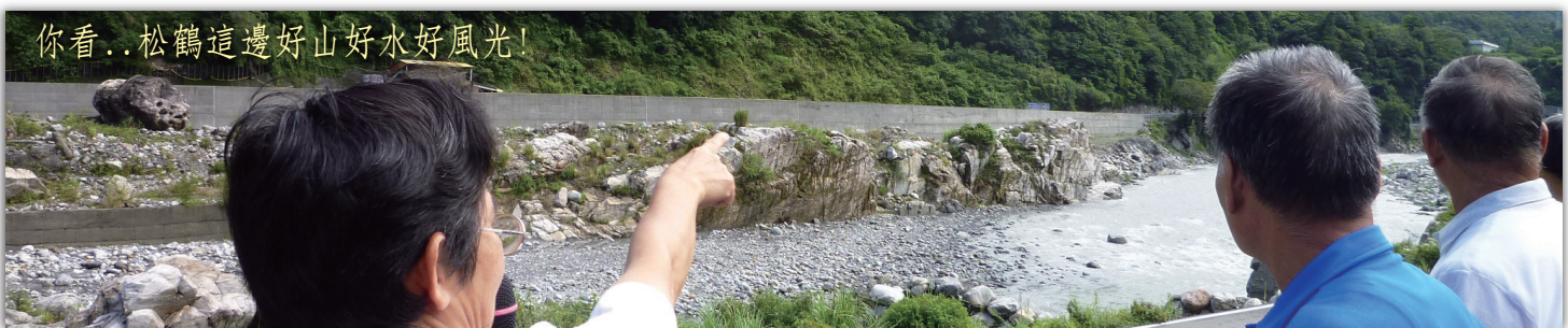
你看..松鶴這邊好山好水好風光！

松鶴部落曾遭逢水災無情的打擊，部落的居民仍然抱持積極修護的精神，經過整修後的松鶴，近年朝向觀光休閒發展。重整過後的松鶴仍可發現日治時期的古色建築，仍有著最天然的溫泉，最具代表性的松樹也仍然持續繁衍，幾十年後的松鶴場景不太一樣了，但是居民的熱情一直沒有變。