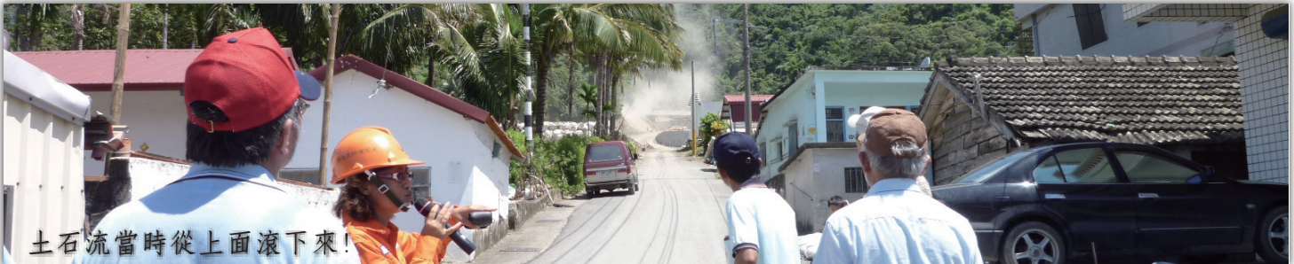
土石流當時從上面滾下來！

大鳥這個名字是從日治時代大鳥萬〈Daichouman〉改成，在排灣語中，原稱巴札曼〈Pacavali〉。走進社區，處處可見濃厚的排灣文化點綴，歷經土石流災害重建後的原住民精神是整個社區的支柱，加上地利之便的明媚山景及廣闊的海岸線風光，來到大鳥體驗原民文化和風景氣勢之美，彷彿人間最後一片淨土。