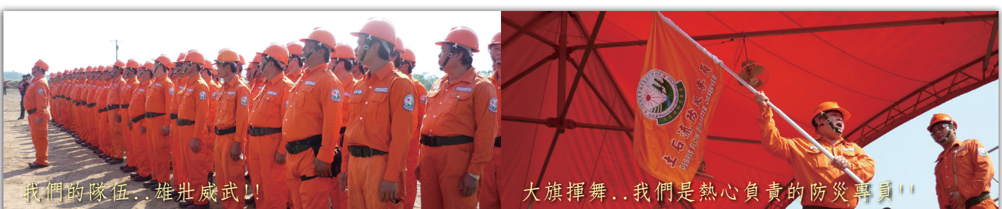
我們的隊伍..雄壯威武!!

今年的土石流防災疏散避難大型示範演練在嘉義縣中埔鄉盛大舉行，現場動員消防、警察、民間組織(紅十字會)、地區醫院、特種搜救隊、空勤總隊、無人載具及土石流行動觀測站、公共事業及社區民力逾1200人參與，演練過程緊湊逼真。