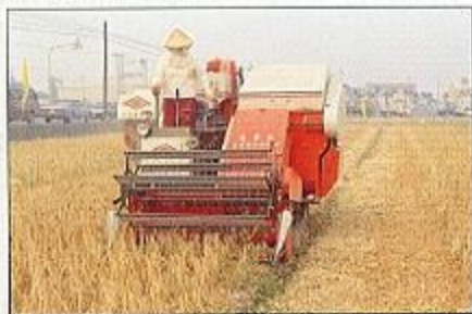
撒播使機械收穫更易操作