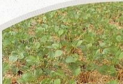
撒播栽培生育正常