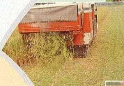
撒播後須全面覆蓋稻草