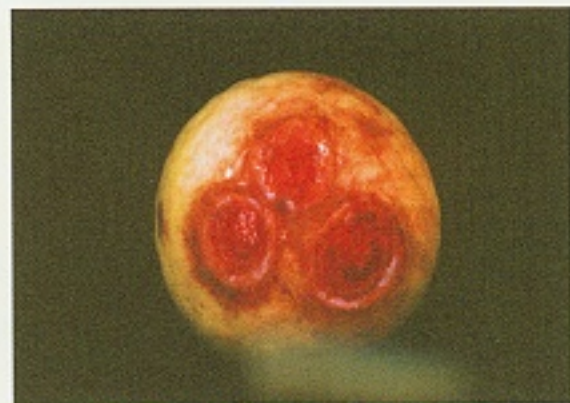
▲ 炭疽病危害果實產生輪紋狀