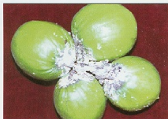
▲ 柑桔粉介殼蟲危害果實狀