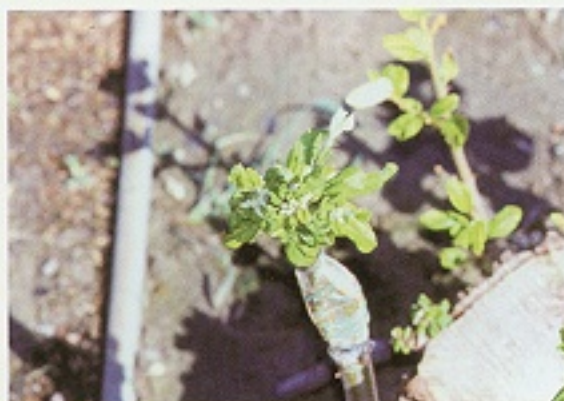
▲ 柑桔粉介殼蟲刺吸後，會造成嫁接新梢捲曲，似毒素病病徵

可參考使用40%滅大松乳劑1,000倍防治，連續2~3次，上下葉片均須噴佈均勻。