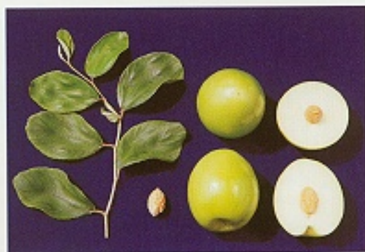
▲蜜棗是目前主要栽培品種