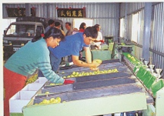
▲ 果子分級機分級作業

印度棗的產期在12月初開始，其果柄周圍光滑平順無皺摺，或果色由淺綠轉黃者為最適的採收成熟度，成熟度愈高糖度愈高，色澤愈黃，愈不耐貯運；成熟度愈低則相反。因此，採收宜控制在八分熟的翠綠色至九分熟的黃綠色之間最適當。一般於田間採收後的果實勿曝曬陽光，要放置於陰涼處，採收過程中可將黃熟果或病蟲鳥害果剔除，尤其經東方果實蠅為害的果實，要用塑膠袋包好，勿任意丟棄田間。