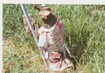
▲利用報紙或塑膠布包裹樹幹後，再用藥劑淋洗樹幹，以達燻蒸殺死小圓胸小蠹蟲。