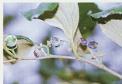
▲棗子果實受白粉病危害造成果實褐化狀

於發病初期，可參考使用40%邁克尼可濕性粉劑6,000倍、或37%護砂得乳劑8,000倍、或20.8%比芬諾乳劑4,000倍、或10.5%平克座乳劑3,000倍防治等藥劑任選一種噴灑防治之。