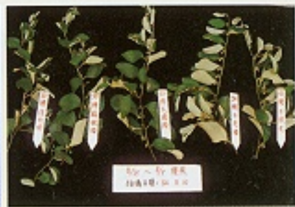
▲不同光源照光之結果情形