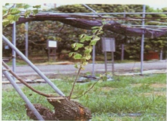
▲棗子嫁接接受小圓胸小蠹蟲危害，造成萎凋現象。