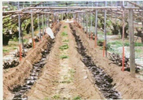
▲ 基肥期間溝施用纖維性有機肥料與磷肥