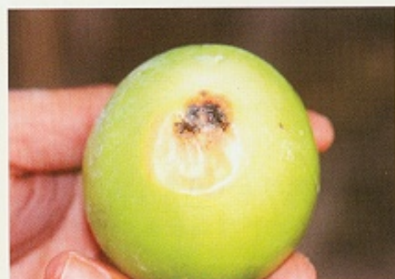
▲ 炭疽病危害果實狀