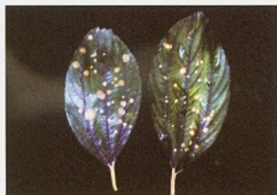
▲ 輪紋病危害葉片狀