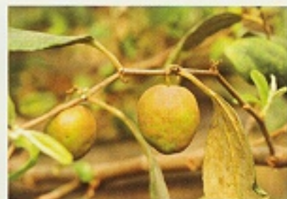
▲棗子果實受白粉病嚴重危害造成生鏽狀