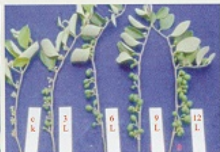
▲夜間不同照光時數之結果情形