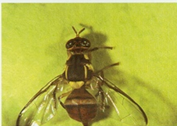
▲ 東方果實蠅的成蟲

害蟲首推東方果實蠅，本蟲為多種果樹的主要害蟲，又稱「蜂仔」，其寄主種類達31種，成蟲棲宿作物亦甚複雜，至今仍甚為猖獗。本蟲於全年可發生，一年發生8-9代，以6-9月密度最高，在10~11月及隔年3~4月危害較嚴重，冬季低溫時發生最少。成蟲形如家蠅，身體呈橙黃色，平時棲息於樹林或果園，取食蚜蟲、介殼蟲等昆蟲所分泌的蜜露和植物花蜜，雌雄交配完成待卵子發育成熟後飛入果園，產卵於果實近表面的果肉內，幼蟲孵出蛀食果肉，致果實早熟後腐爛、落果，失去商品價值。老熟幼蟲會鑽出果皮表面跳入土壤中化蛹，在土中轉化成蟲鑽出地表，再度為害果實。雌蟲最多可產卵1,200粒，每天約產卵30粒，產卵期長達一個月以上。雌蟲生殖器插入水果後，一次可產1-4粒卵，高溫期一世代少於一個月。