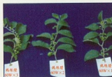
▲不同強度照光結果情形

因此，筆者建議，日光燈數、每晚照光時數、照光日數都可視植株開花著果表現來調整，即枝梢已明顯有些綠豆大小的棗子幼果時，即可準備關燈了。