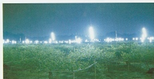
▲棗樹夜間燈照情形

單一品種例如蜜棗欲提早產期，可利用提早主幹更新，配合夜間燈照方法施行。蜜棗之植株於國曆1-3月間施行主幹更新，待枝梢發育4個月左右，即花苞出現為照光適期。亦即5-7月的夜間，每公頃架設70-120盞40w日光燈，每夜照射6-9小時，處理20-40日，產期可提早至9-11月，較