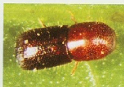
▲小圓胸小蠹蟲成蟲