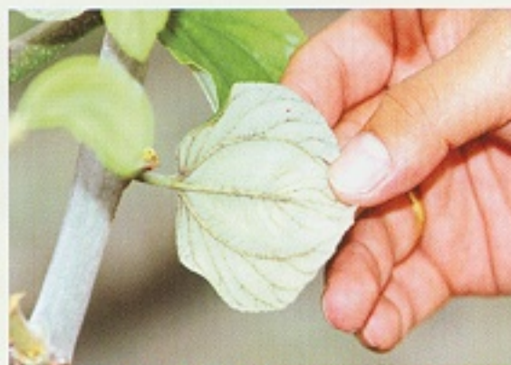
▲ 受柑桔粉介殼蟲危害時，會分泌蜜露，形成煤煙，俗稱黑煤或煤煙病