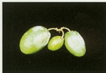
▲棗子果實受白粉病危害狀