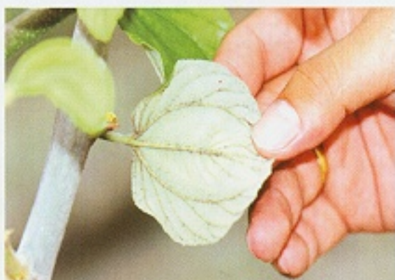
▲ 棗子葉片受粉介殼蟲、介殼蟲或小綠葉蟬等同翅目昆蟲危害後，會分泌蜜露，造成煤煙現象，稱黑煤病或煤煙病。

黑煤病在葉片上表面產生一層黑色菌絲，生長旺盛時，會蓋滿全葉片，使植株的光合作用降低，菌絲並不侵入植物表皮細胞。