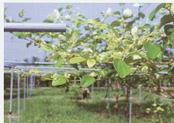
▲ 票子葉片缺微量元素鎂時，葉片之葉脈明顯，而其他部位則有黃化現象(一)。