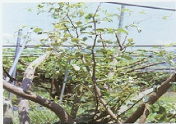
▲受褐根病危害後，植株產生萎凋現象。