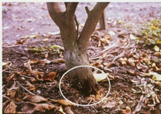
▲ 菓子樹幹受星天牛危害狀