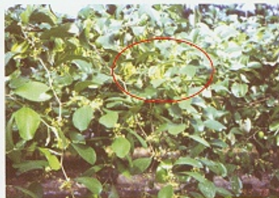
▲ 棗樹葉片缺鎂黃化(紅圈處)

土壤測定及葉片營養診斷結果是合理化施肥的重要依據，否則容易施用過量或未施入缺乏要素，而影響印度棗之正常生育。高、屏二縣印度棗產區常見缺鎂與缺硼問題，農友可參考本場推薦之施肥方法改善，以提高棗果產量與品質。因土壤性質及氣候、水分等因素影響，可調整施肥推薦量或方法，但亦應以樹勢反應及經驗為判斷依據，絕不能盲目施用。✎