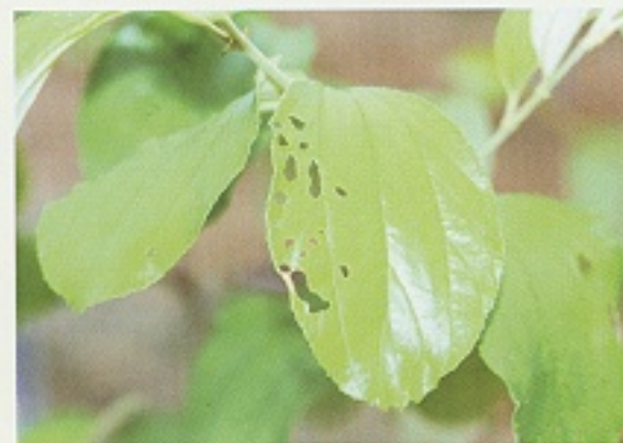
▲臺灣黃毒蛾幼蟲啃食葉片造成孔洞狀