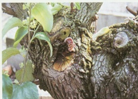
▲棗子植株受根基腐病危害後，樹幹產生靈芝現象。

即俗稱木材腐朽現象。此類病害多由靈芝屬( Ganoderma )所引起，多種靈芝屬如南方靈芝( G.australe )，靈芝( G.lucidum )，韋伯靈芝( G.weberianum )等皆會造成印度棗根部感染，後期易發生枯萎死亡的現象，就褐根病與根基腐病的枯萎死亡速率而言，褐根病形成枯萎相對較快速，故對農友的損失影響較大。