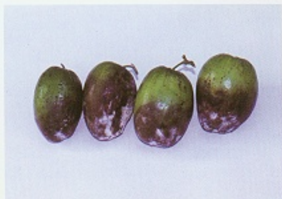
▲ 梨子果實受疫病菌危害，產生腐酸味，且長出白色菌絲。

本病目前無推廣藥劑，若雨季來臨前，可噴施1,000ppm（約稀釋1,000倍）亞磷酸2~3次，每七天一次，有良好之預防效果。使用時，亞磷酸須以相等重量之氫氧化鉀中和酸性。或發生時，請參考使用80%快得寧可濕性粉劑2,000倍防治。發病初期開始施藥，每隔7天施藥一次，連續3次。應注意安全採收期。