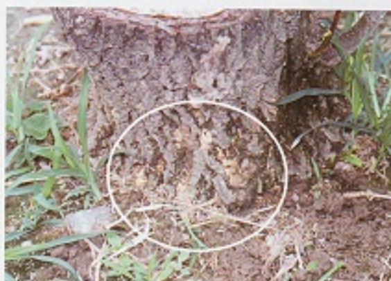
▲棗子樹幹受小圓胸小蠹蟲蛀食危害後，會有蟲糞及木屑產生。

於棗子強剪、嫁接或生育期時，可利用舊報紙先把樹幹包起來後，以40.64%加保扶水懸劑200~500倍或44.9%陶斯松乳劑200~500倍淋洗樹幹；或藥劑處理後，以塑膠布包裹樹幹密閉，藉藥劑燻蒸及密閉，使小蠹蟲死亡，以達防治效果；採收期時，可參考使用3%亞滅寧1,000倍乳劑、或9.6%益達胺溶液1,000倍淋洗樹幹基部防治之，但於採收時，使用藥劑須注意安全採收天數，嚴禁農藥殘留。