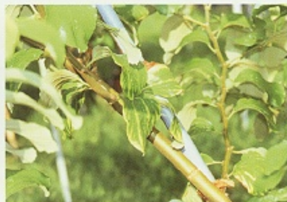
▲ 票子葉片缺微量元素鎂時，葉片之葉脈明顯，而其他部位則有黃化現象(二)。