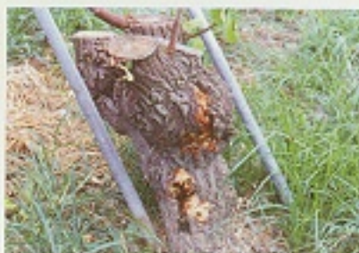
▲棗子樹幹受小圓胸小蠹蟲蛀食危害後，會有流膠現象