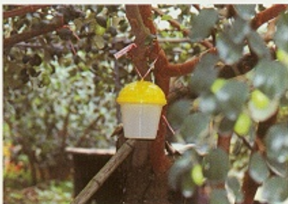
▲ 利用長效型誘殺器誘殺果實蠅雄蟲