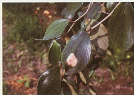
▲ 輪紋病危害葉片產生輪紋狀褐色大型之病斑