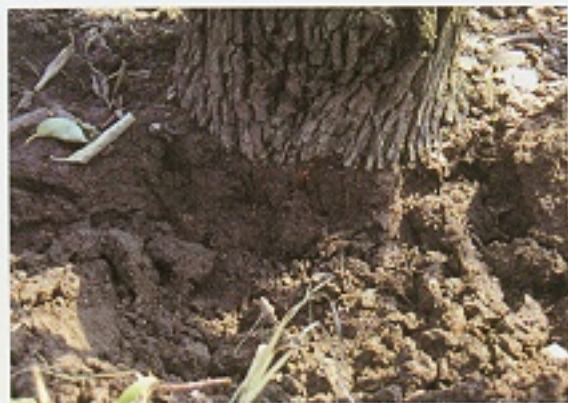
▲受褐根病危害後，植株樹幹產生腐爛現象。