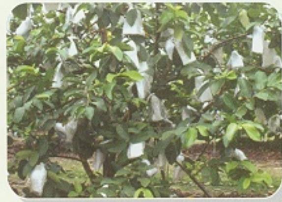
▲ 管理良好，番石榴結實累累