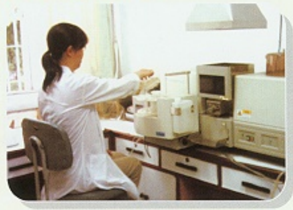
▲荔枝營養診斷可採取花穗下方成熟葉片(左)進行分析(右)