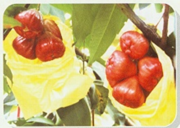
▲ 適度肥培及合理施用有機質肥料提高蓮霧品質