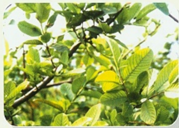
▲ 番石榴缺鐵新葉黃化（近照）