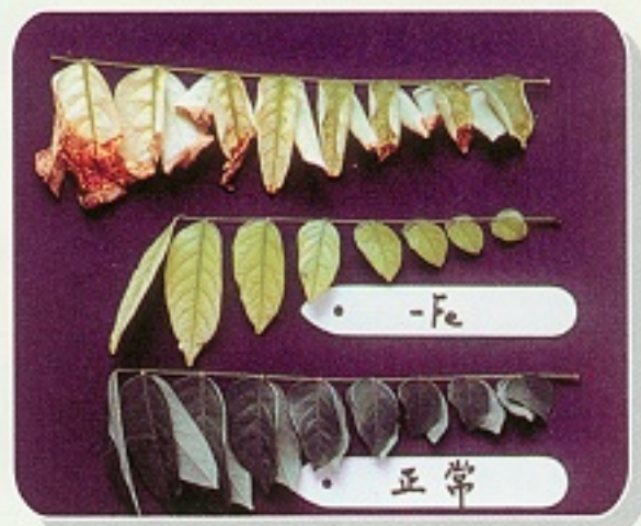
▲ 楊桃缺鐵會自幼葉開始黃白化 (圖片轉載高雄區農技報導第9期)