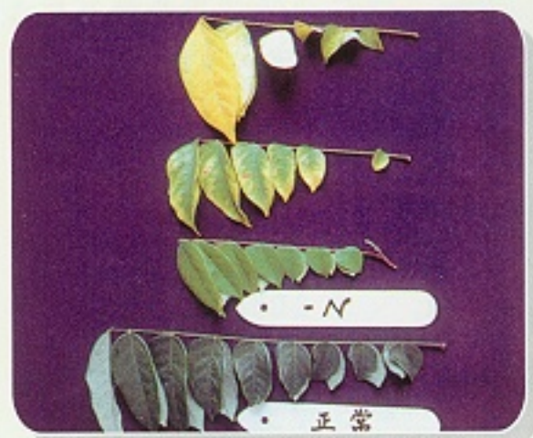
▲ 楊桃缺氮會自老葉開始黃化 (圖片轉載高雄區農技報導第9期)