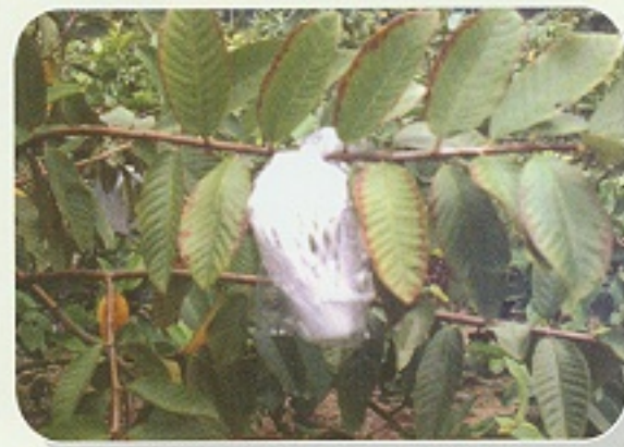
▲ 番石榴缺鉀，葉緣焦枯狀