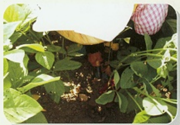
▲ 根瘤菌接種後調查紅豆植株生育情形