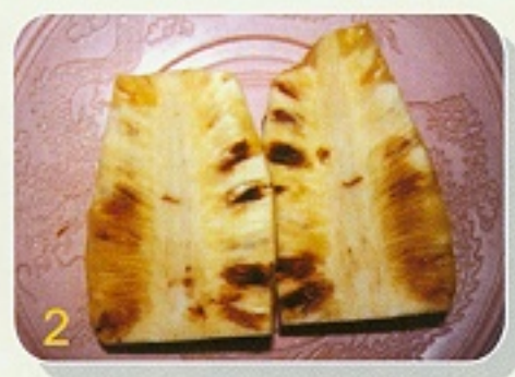
▲鳳梨的一些生理障害可能與元素鈣及硼的缺乏有關(1:果心斷裂, 2:花樟病)