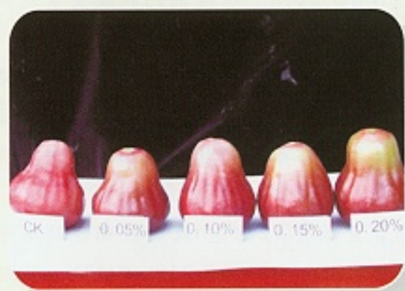
▲ 微量元素錳施用改善蓮霧外觀品質