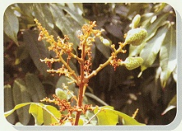
▲荔枝裂果(左)或落果(右)與營養元素缺乏有關