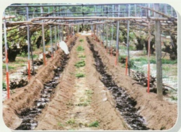
▲ 基肥期開溝施用纖維性有機肥料與磷肥