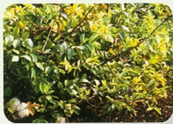
▲ 番石榴缺鐵新葉黃化