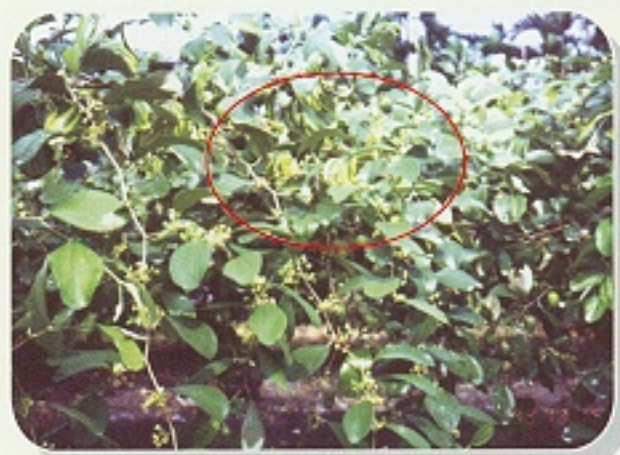
▲ 棗子缺鎂時之葉片黃化現象