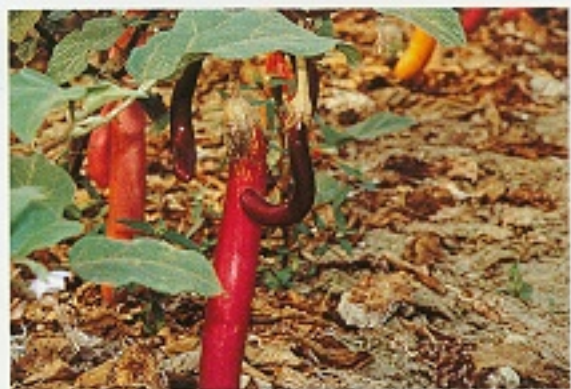
▲ 南黃薊馬造成茄果彎曲狀

神澤氏葉蟎的主要發生期是在每年10月～至翌年1-2月為其高峰期，剛好是茄子生長期，故危害較嚴重。神澤氏葉蟎以為害老葉為主，當密度很高時，亦為害嫩葉，造成葉片黃化，甚至落葉，影響植株光合作用，使植株生長勢減弱，降低茄果品質與產量。因神澤氏葉蟎生活史短，世代多，繁殖力強，在施藥頻繁之情形下，易產生抗藥或耐藥性，使得防治效果不甚理想，造成農民很大困擾。而上述兩種葉蟎發生期多在乾燥溫暖的冬作。成蟎與幼若蟎喜於茄葉背面吸食汁液，造成葉片上密佈細小白點，接而黃化、褐化且乾枯，其增殖甚速，大量發生時，影響產量品質甚大。