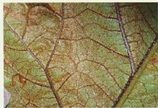
▲ 茄葉受茶細蝨為害狀