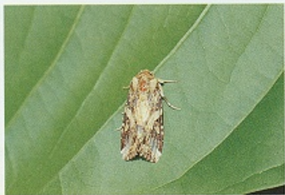
▲ 斜紋夜盜蛾成蟲狀