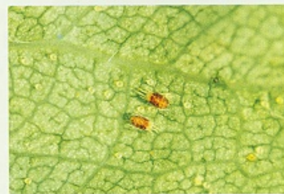
▲ 神澤氏葉蟎成蟎及其卵狀