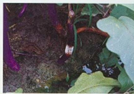
▲ 茄子疫病罹病果實（一）

病原生態：台灣由於高溫多濕，冬季又缺少低溫來降低病原菌之密度，疫病之發生一般十分猖獗。茄子果實疫病於適溫高濕（20—25℃，相對濕度90%以上時）之環境發生，全年均可發病，但以降雨頻繁之夏秋時節發病較嚴重，可能於短期內造成茄果大量罹病、落果。潮濕的環境有助於疫病菌胞囊與游走子的形成與傳播。與其他土壤傳播性病害不同，疫病之病勢進展往往是爆發性的，只要有感病之寄主、適合之發病環境與少量之初次感染源，病害即一發不可收拾。疫病之發生受環境因子中『水分』之影響最大，病害一旦發生，病菌在10多小時內就可產生大量胞囊，釋放游走子。病原菌如果因而侵入植株，誘發病害，只要兩三天就可出現病斑，再產生胞囊，循環不已。因此，疫病菌之病害史（disease cycle）需時極短，只需3-5天，病害傳播蔓延極為快速。