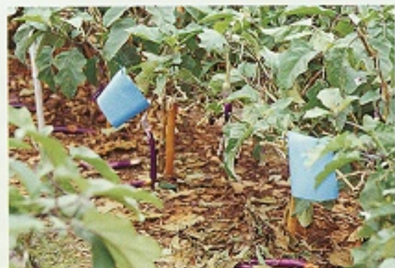
▲ 懸掛藍色黏板可預測南黃薊馬數，兼具誘殺南黃薊馬功能