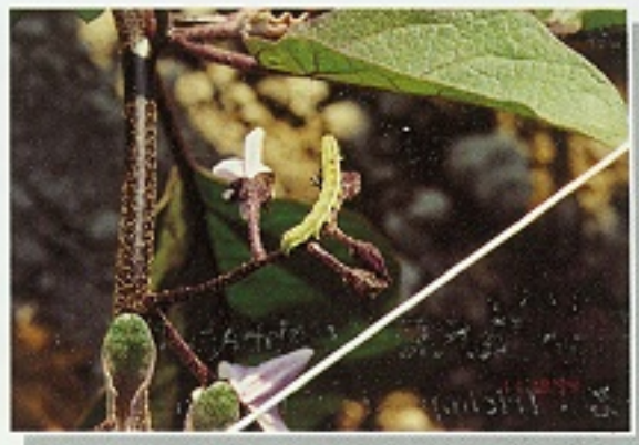
▲ 番茄夜蛾危害葉片狀

可參考使用40%加芬賽寧乳劑且加上蘇力菌2,000倍噴灑，最好於下午2-3點時噴灑，每隔7至10天施藥一次，採收前10天停止施藥。