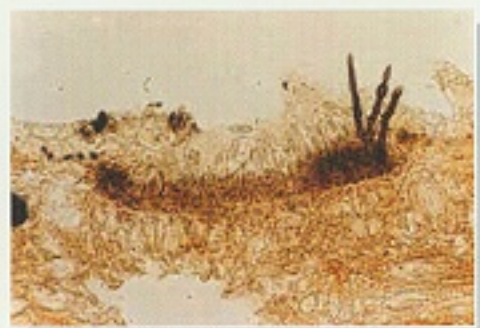
▲茄子炭疽病病原菌孢子

病徵：茄子發生炭疽病的情況極少，但曾有報導茄子感染此病。受害茄子果實，表面產生黑色點狀，組織無法繼續增生，在尾端隘縮。成熟的果實表面感染炭疽病後，產生水漬病斑，後期病斑產生輪狀黑色小點，並有鮭肉色粘質釋出，為分生孢子。