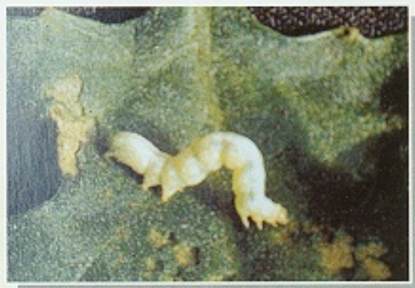
▲ 擬尺蠖幼蟲危害茄葉狀

每年之世代數五、六代左右，幼蟲行走時，以腹足與胸足相靠近體呈倒U型。主要發生於冬季之12月至翌年2月。幼蟲期約14~16天，蛹期約8天，成蟲壽命約14天，產卵量在800粒以上，卵期2~3天。幼蟲老熟後，即在葉裡作橢圓形之白色薄繭化蛹。