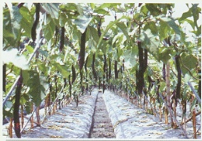
▲ V型整枝法結果情形