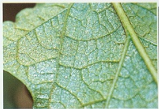
▲ 茄葉受神澤氏葉蝨為害狀(背面)

可參考使用植保手冊推薦茄子蝨類之藥劑，或以25%新殺蝨乳劑500倍，於害蟲發生時施藥，採收前14天停止用藥。