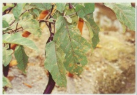
▲ 番茄斑潛蠅危害葉片狀

在茄子上，目前尚無推薦防治本蟲之藥劑，可參考使用75%賽滅淨可濕性粉劑5,000倍，於發生時每隔7天~14天施藥一次，採收前7天停止施藥。