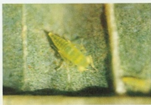
▲ 小綠葉蟬幼(若)蟲狀