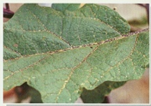
▲ 南黃薊馬危害葉片狀

成蟲及幼蟲於芽、葉、花、幼果等部位以銼吸式口器吸食危害，尤其嫩葉與新梢受害較嚴重，受害葉片黃化乾枯，茄株下層老葉聚集的薊馬尤多。田間受害茄葉可由主脈兩邊白色斑紋判別，對於幼果的為害則群聚於果實與萼片附近吸食，造成白色或褐色條斑有如生鏽斑狀，嚴重時可使果實彎曲變形，影響品質價格甚鉅。