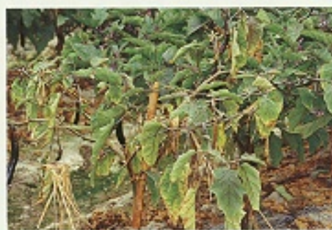
▲ 小綠葉蟬危害造成植株黃葉現象