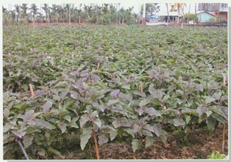
▲ 摘除老葉有減少果實腐爛、促進通風和果實著色的作用

定植後20~35天去除始花節位以下之葉片及蘗芽，以提高始花節位高度，與其他蔬菜間作也可達到相同效果。始花期行雙幹或V型整枝，兩幹因開花性各自形成兩結果母枝。始花期後2-3個月內，果實下面保持2~3葉為原則，每花序僅留1果。株勢已固定時，即行摘心作業，將主枝條頂端之嫩梢摘