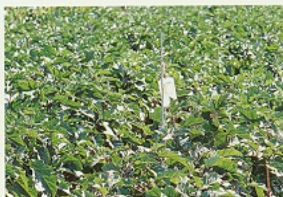
▲ 懸掛性費洛蒙預測斜紋夜蛾數及誘殺雄成蟲