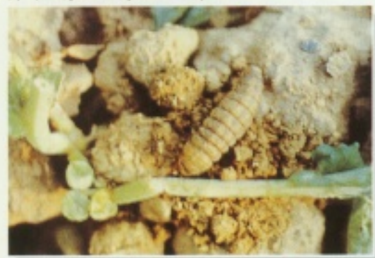
▲ 切根蟲危害苗期植株狀

幼蟲白晝潛伏於土壤中，夜間外出啃食植株幼嫩地際部，使被害植株因斷莖而倒伏。被害的植株無法再繼續生長，待作物成長後，因莖基部較堅厚無法切斷，幼蟲則會