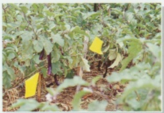
▲ 懸掛黃色黏板可預測粉蝨數及誘殺粉蝨

可參考使用果菜類藥劑，如2%阿巴汀可濕性粉劑1,000倍、50%布芬淨可濕性粉劑1,000倍、9.6%益達胺溶液1,000倍、16%可尼丁水分散粒劑3,000倍等藥劑防治之。害蟲發生時，7天噴藥一次，連續2-3次，於果實採收前14天停止施藥。