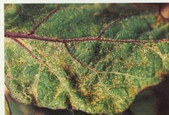
▲ 茄葉受神澤氏葉蟎為害狀(正面)