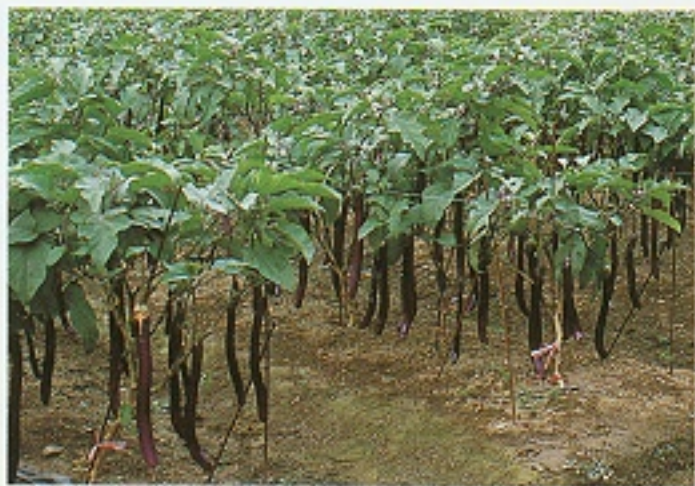
▲ 水平棚架整枝方式

茄子忌連作，宜選擇未曾種過茄科作物之田區種植，或與豆科作物或水稻輪作。此外，也應注意田間之衛生，去掉之枝葉及病蟲害果宜集中銷毀，勿棄置田間，以減少病蟲滋生之環境，並可有效抑制青枯病、疫病之蔓延。