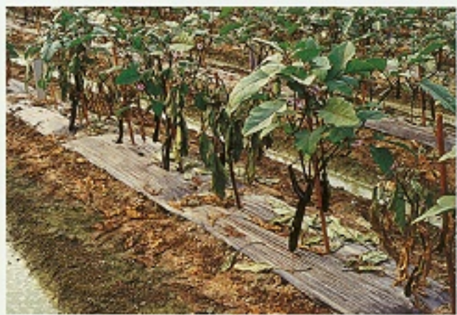
▲ 茄子青枯病田間病徵

病原生態：本病原細菌寄主範圍頗廣，可感染200多種植物，臺灣常見的寄主是茄科植物，另可為害落花生、天堂鳥花、草莓及紫蘇。本細菌為土壤傳染病菌，由根部傷口侵入植物體內，被害植株由根部釋放多量的病菌到土壤，感染鄰近健康植株根部，或經由灌溉水帶到其它田園感染。下雨時亦可由地上部傷口侵入，高溫多濕時