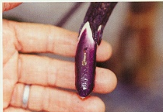
▲ 番茄葉蛾危害茄果狀

卵呈饅頭狀，上部略細長，上端圓而呈淡綠色或淡黃色，卵面有縱隆起線，孵化前，呈黑褐色，直徑約1公厘；幼蟲體色多變化，同一對成蟲所產之卵，孵化後之幼蟲體色亦互異，至少有15種以上之顏色變化。甫孵化之幼蟲灰綠色，待取食後，尤其3齡以後之體色遂不同。幼蟲之顏色，通常為綠色、深綠色、褐色、黃褐色、黃