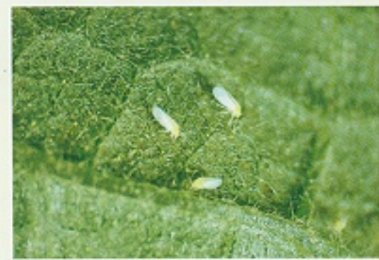
▲ 銀葉粉虱危害茄葉狀

成蟲期壽命可達1~2月，完成一世代僅需19~27日。母蟲一產卵可達200~300粒，孵化後之若蟲有四齡，一齡有足，可行走尋找適當寄主；二齡以後，足退化，固著於中老葉，以刺吸式口器刺吸植株之養液；羽化後之成蟲，繼續危害，或再飛至其他之新梢葉背組織產卵。成蟲多群棲於新葉之葉背，成蟲不擅長距離飛行，一般受干擾時，會在植株上端或周圍稍作盤旋後，仍回原作物棲息危害。一般以風力傳佈，除直接刺吸養液，且誘發分泌蜜露，引起煤煙病外，