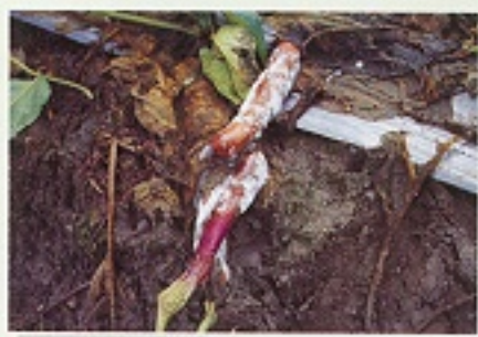
▲ 茄子疫病罹病果實（二）

Phytophthora capsici 之寄主範圍包括辣椒、甜椒、番茄、茄子、瓜類、康乃馨、滿天星、大理花、萼花等。 P. Parasitica 的寄主更為廣泛，全台有記錄者計50餘種。疫病菌之初次感染源可能來自1.灌溉流水中之游走子。2.幼苗帶菌。3.土壤及前期作物之殘體中之病菌。疫病菌平常靠菌絲或厚膜孢子存活於土壤、或其他相鄰田園之寄主植物上，等降雨過久或灌溉過於頻繁時，導致土壤濕度飽和，誘發病菌產生胞囊及游走子。游走子可在水中游泳，或藉灌溉流水、或靠風雨吹送至遙遠之田園，侵入感染，誘發病害。病徵：果實被害，果實表皮初期呈現褪色水浸狀塊斑，病斑褐化迅速擴展成大型圓斑，果實斷落，或整個果實掉落地面，病斑上略微長出白色霉狀物，病菌並向果實內部蔓延，切開後可見果肉褐化。果實於採收後，染病果實亦可能於儲運期間發病，而傳染至其他相鄰健果。