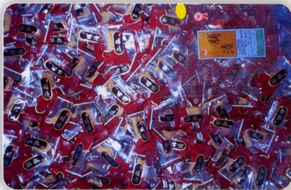
圖一 製成小包裝的脯漬產品

蘿蔔是台灣重要經濟作物之一，冬季裡作收穫期大約集中在每年12月上旬至次年2月底止。根據90年農業統計年報資料，目前蘿蔔種植面積約4,431公頃，主要分佈在台南、嘉義、雲林等縣市，高屏地區亦有少量栽培。蘿蔔每公頃產量大約150~200公噸之間，估計年產量約775,000公噸，蘿蔔收穫後除作為家庭鮮食外，約有236,000公噸係作為加工原料，其中約有87,000公噸係製成蘿蔔乾、菜脯、客脯、條脯、瓜脯等產品送到市場銷售或作成小包裝脯漬（圖一），成為茶餘或閒暇下酒的絕佳佐料，直銷到國內生鮮超市頗受消費者的喜愛，加工後產品價格若以市價每公斤7.5元計算，則總產值約6億餘元，可為農民帶來龐大的收益。