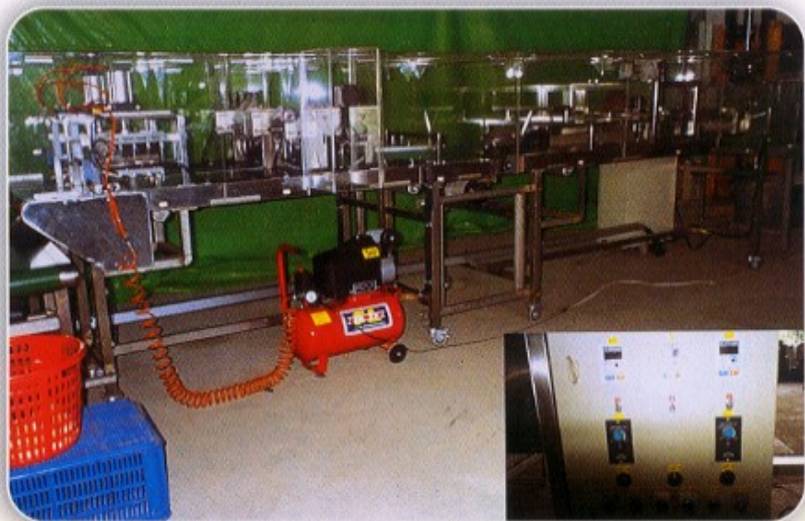
圖四 蔬果加工一貫作業化機械側視圖