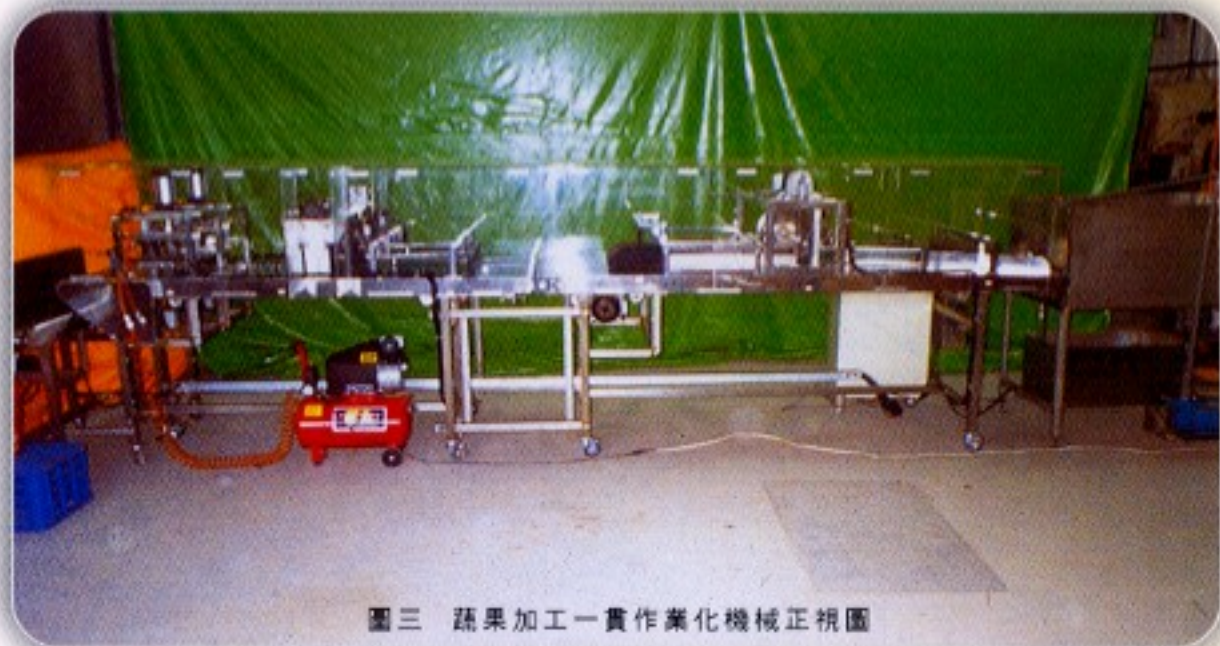
圖三 蔬果加工一貫作業化機械正視圖

以上各單元處理模組均按裝在整台機體平台上，機體高度適合人體工學操作，簡單又方便，為單一化按鍵式控制作業模式（圖三、圖四）。