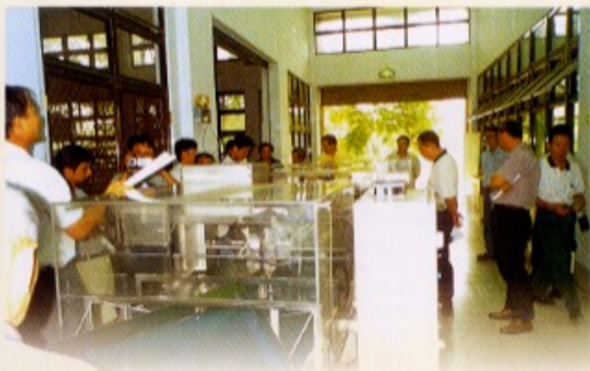
圖七 機械操作示範觀摩會

本機已商品化具實用性，目前已由翊崇企業有限公司進行製造生產，推廣給農民使用，91年在農委會經費補助及農民出資配合下，嘉義崙尾果菜運銷合作社已購置1台使用中。本機曾於91年9月12日於國立屏東科技大學食品系加工廠辦理操作示範觀摩會，示範成果頗受與會者好評（圖七）。本機具有許多創新技術，為維護智慧財產權，由行政院農業委員會代為申請本國發明及日本新型專利權，於91年6月22日獲得日本實用新型專利（登錄第3086792號），92年6月10日獲得中華民國發明專利（發明第171919號）。