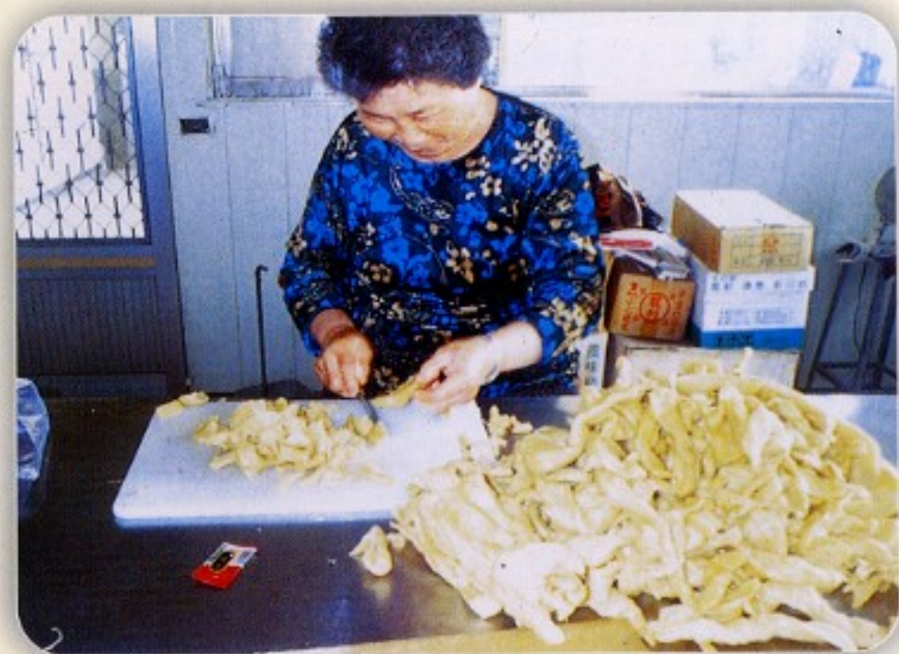
圖二 人工切削作業情形

蘿蔔直接從田間採收後，必須先將果蒂切除乾淨，經刷洗處理完成後，利用人工手持切刀把整條蘿蔔切成一半，再分層縱切成紡錘或條狀形後，才進入調製過程。若要進一步加工，則先添加調味料調製後橫向切成塊狀，外加包裝即成可口的脯漬產品。此一系列加工過程現階段均需依賴人工作業（圖二），不但作業效率甚低，每小時約60公斤；而且成本高，其僱工費用約占脯漬加工製成品之總人工費用之60%左右。同時切削過程十分危險，又容易影響產品的品質與衛生。針對上述國內農民及產銷班普遍的需求，本場承行政院農委會經費補助，積極進行規劃與設計，歷經三年餘，成功研發出「蘿蔔切割加工一貫化作業」之機械。從整條蘿蔔之供給到切成紡錘形規格化之塊狀出料，此一系列切割處理均不需經人手觸摸，輸出物料即可進入調製加工成產品後包裝，對提高作業效率及產品品質與衛生助益甚大。本機械現已經由合作廠商嘉崇企業有限公司進行商品化設計製造完成，將推廣給農民使用。茲將本機械各項機構功能及作業效益加以介紹。