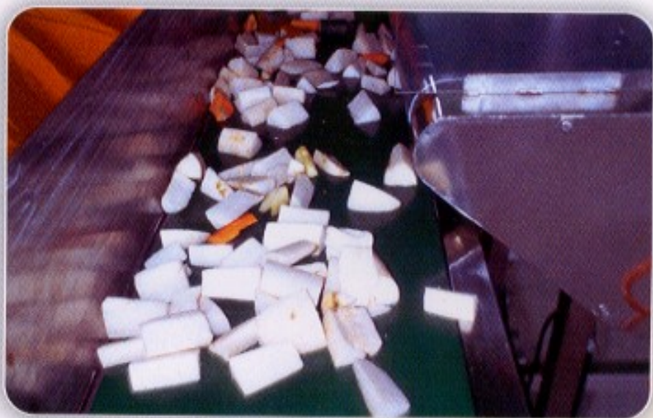
圖六 利用作業機械切出塊狀物料