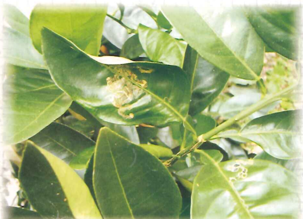
潰瘍病病斑上殘存細菌是感染源