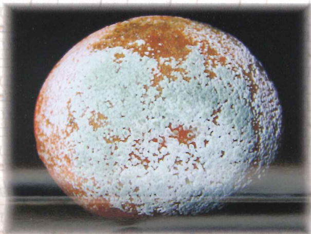
柑桔貯藏性病害—柑桔青黴病