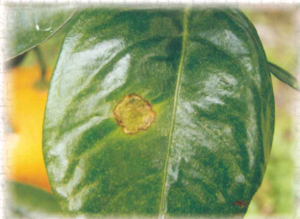
介殼蟲危害果實也在枝條殘存