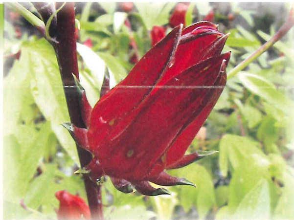
洛神葵勝利品種的萼果

洛神葵在臺灣以中部以南及東部少量種植，主要產區在臺東縣及屏東縣，而以臺東縣栽培最多，一般有150至300公頃左右，主要集中在臺東市、金峰鄉、卑南鄉、太麻里鄉、初鹿鄉、大武鄉。在臺東縣之山地鄉，算是一種重要之經濟作物。金峰鄉公所每年都會舉辦洛神花之旅，鄉內訓練有素之解說員，帶領遊客參觀洛神花田，並了解當地原住民之文化。太麻里地區農會也積極輔導當地洛神葵的產業，成立了洛神花產銷班。臺東地區農會積極輔導農民，