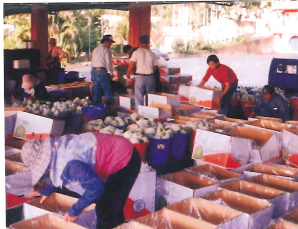
外銷鳳梨釋迦分級包裝作業情形