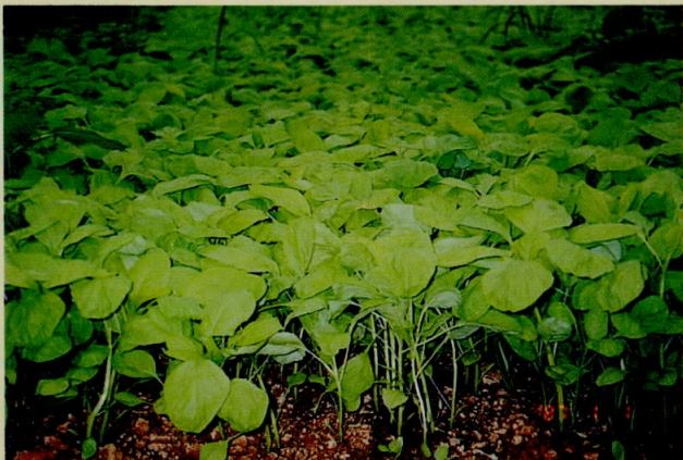
圖八、萵菜機械播種後生長整齊