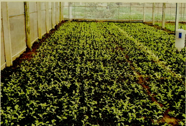
圖四、機械播種後蔬菜生長情形良好不需間苗作業