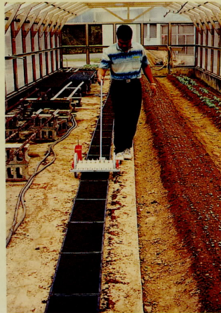
圖九、播種機應用於育苗箱之播種情形