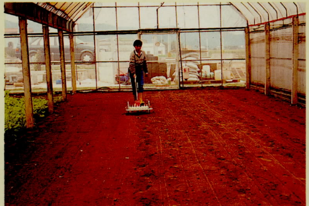
圖二、播種機在網室內播種情形

手拉式蔬菜播種機，以取代動力真空式播種機，期望能儘速提供農民使用。本機自81年7月起，在中正農業科技基金會之經費贊助下，開始設計試造，並逐步加以改良，至今已達實用階段，並以完成技術轉移給台中縣清水鎮康榔機械公司，做商品化生產。茲將本機之研發過程及播種功能說明如后，以供參考。