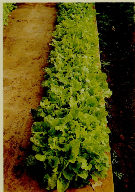
圖十、東京小白菜在育苗箱上之生長情形