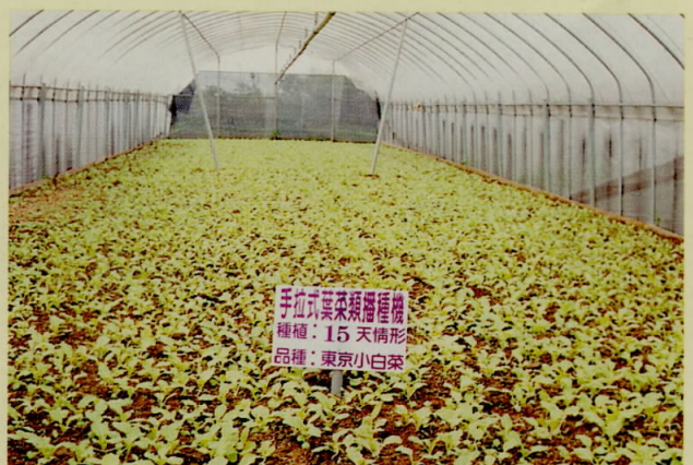
圖六、東京小白菜機械播種後15天之生育情形