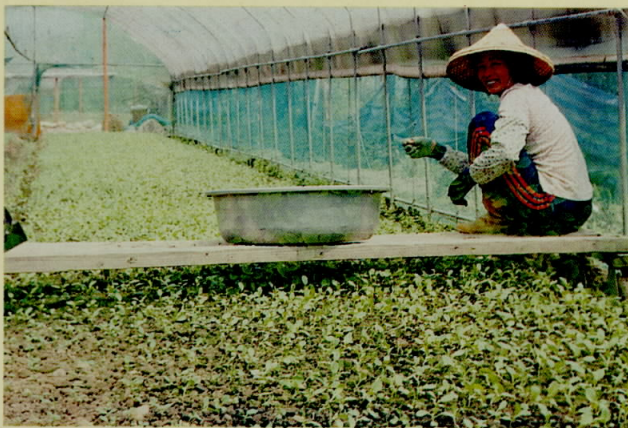
圖三、人工播種後間苗作情形