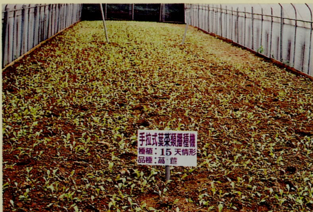
圖七、萵苣機械播種後15天之生育情形

本播種機使用方法簡單，只要將種子倒入適用型式之播種機之種子槽內，到田間或網室以手拉方式即可播種，非常輕便且精確度高，不僅不會缺株，而且不需間苗作業。本播種機亦可用於箱式有機葉菜類之播種。