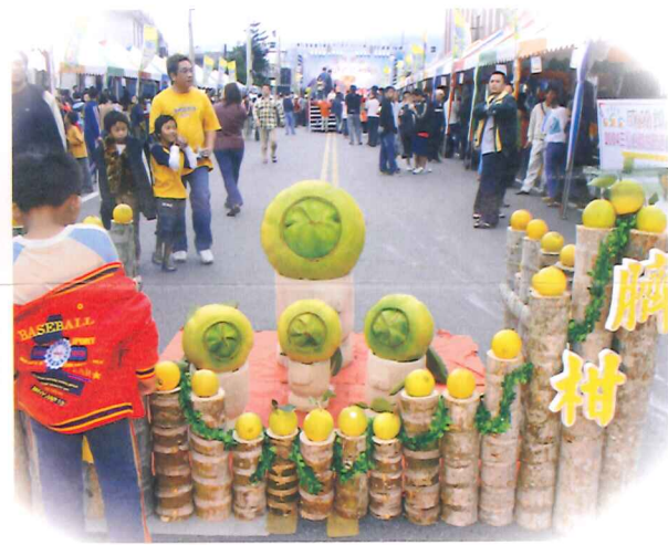
成功鎮農會每年約在11月中、下旬會舉辦臍橙節慶祝活動