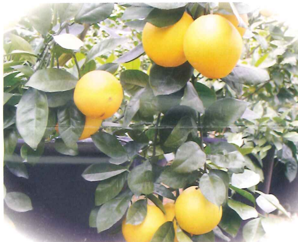
華盛頓臍橙結果情形