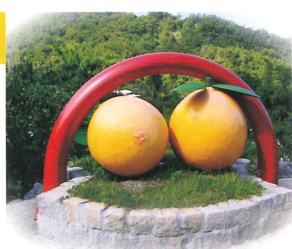
成功鎮“柑仔山”設立之華盛頓臍橙標誌

華盛頓臍橙由於花粉和胚珠異常，果實通常沒有種子，所以對環境極為敏感，如遭遇不適當氣候常造成嚴重之落