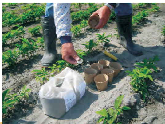
圖8. 番荔枝幼苗接種菌根菌之情形。