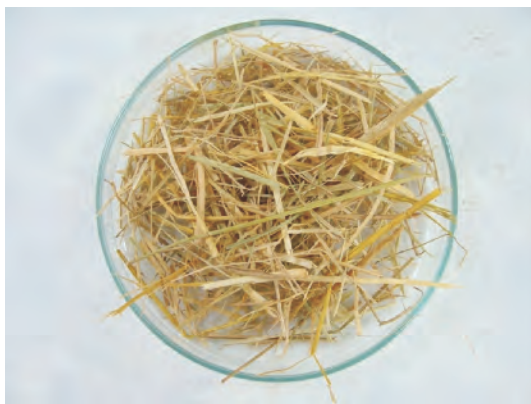
圖3. 未經碳化處理之稻稈

顯著差異，由分析結果顯示添加碳化稻稈液肥可提升葉片鉀及鈣元素含量，而鉀及鈣皆為植物所須之重要營養元素，鉀為蛋白質合成所須之輔因子而鈣為細胞間質果膠的構成成分。另於太麻里鄉及臺東市番荔枝果園進行碳化稻稈液肥光照肥培試驗，於番荔枝冬期果開花前及開花期各噴施不同液肥，已採集噴施液肥前之葉片及土壤樣品進行營養元素含量分析，將於100年度果實可採收時，進行噴施後葉片、土壤樣品及果實品質分析，以了解碳化稻稈液肥對光照處理之番荔枝果園之土壤及植體營養元素含量及果實品質之影響，預期可提升土壤及植體營養元素含量及作物品質。未來將持續研發碳化資材液肥並應用於有機農業肥培管理，提升作物品質。