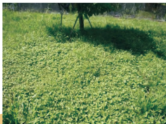
圖5. 金腰箭舅（定植1年）

※地點：本場臺東市番荔枝試驗果園草生栽培試驗區（金：金腰箭舅、鴨：鴨舌癩、匙：匙葉蓮子草）