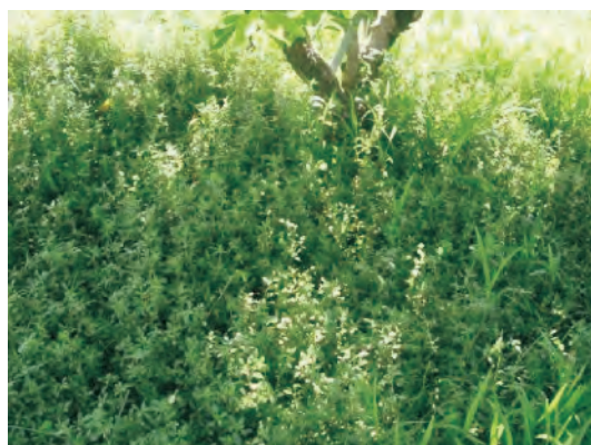
圖6. 匙葉蓮子草（定植1年）