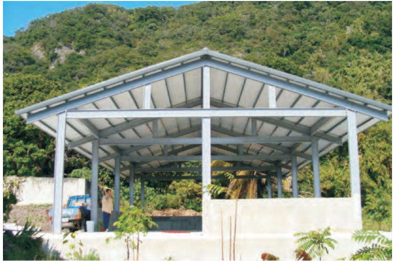
圖7. 堆肥舍外觀，未來將積極配合本場研發適於有機栽培的肥培資材與技術。

作物有機肥培管理模式，並藉由示範觀摩及經驗發表會推廣予農民應用，以推動臺東地區有機產業。