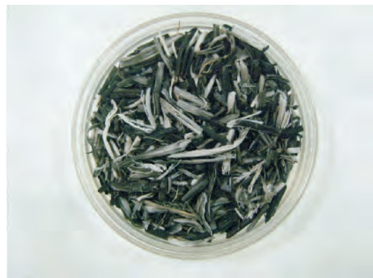
圖4. 經碳化處理之稻稈