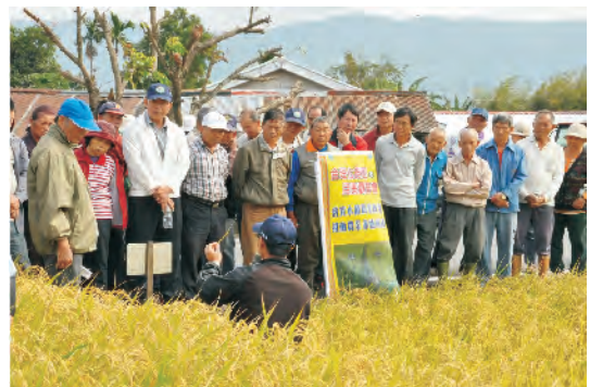
圖2. 本場於池上鄉辦理水稻合理化施肥及安全用藥成果說明會。