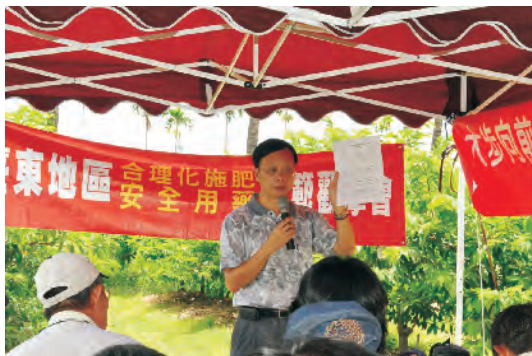
圖1. 本場於太麻里鄉辦理番荔枝合理化施肥及安全用藥成果說明會。