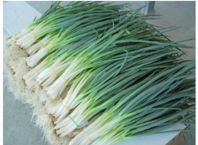
圖10. 有機栽培生產之青蔥，蔥白純白柔軟，品質良好。