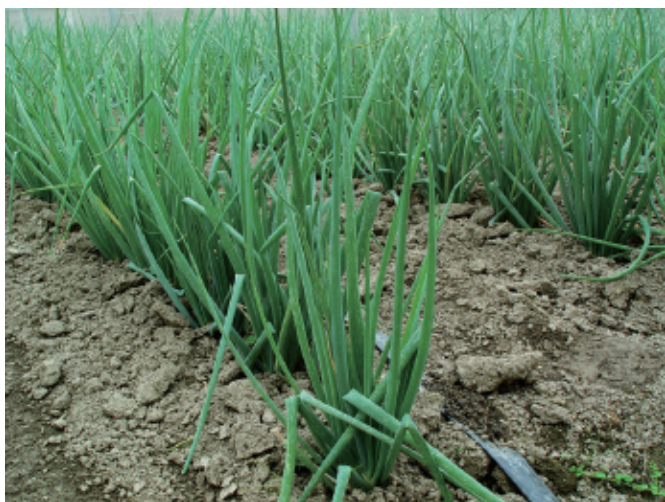
圖5. 培土有利葉鞘的軟白，並使青蔥向上生長。

防治薊馬，危害嚴重時，則以500倍液防治。窄域油防治宜在早晨或陰天時進行，避免高溫下噴施而危害植株生育(圖7、8)。