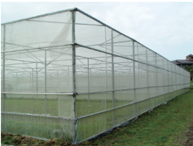
圖1. 鍍鋅鐵搭架，水平棚架結構網室。

(一)網室設施 ：為鍍鋅鐵搭架，水平棚架結構網室，高4公尺，外覆16目白色防蟲網，通風性良好(圖1)。