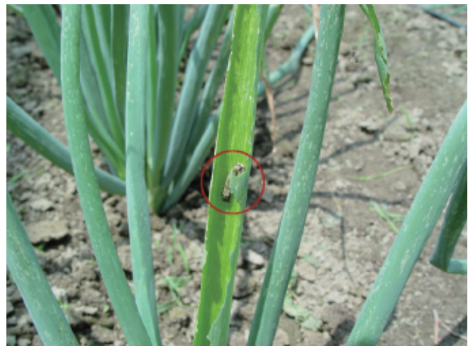
圖7. 甜菜夜蛾(管蟲)為害情形。

(五)施肥作業:種植後1星期，施用稀釋500倍之田寶1號液肥(20公斤/桶)，其後每星期視植株生育情況，以田寶1號液肥稀釋300倍澆灌補充養分。