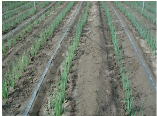
圖6. 青蔥栽培除需適度灌溉外，排水亦相當重要。

的分歧點為要(圖5)。第2次培土則在第1次培土後20-30日進行，以2次培土為宜。青蔥栽培除需適度灌溉外，因植株不耐淹水，故田間排水相當重要(圖6)。以富含有機質土壤所生產之青蔥，蔥白純白柔軟，品質良好。