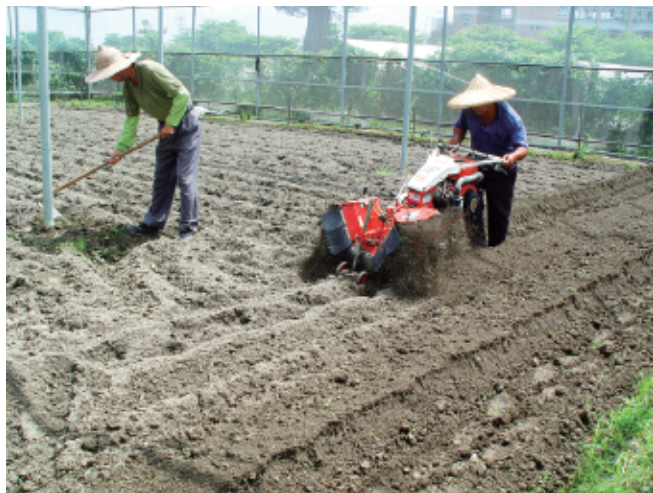
圖2. 定植前先行施肥整地。

(二)整地作畦 ：本田於定植前先行整地，每分地施用固態田寶11號有機肥(20公斤/包)100包當基肥，以中耕管理機耕入土中混勻(圖2)。若本田排水良好，直接以條植方式栽培。