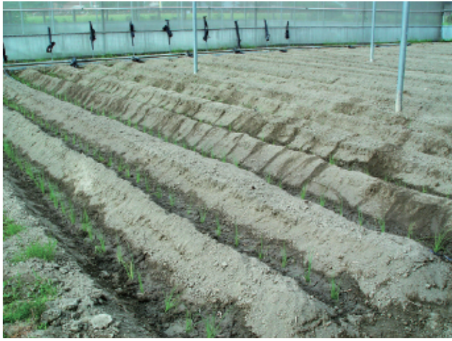
圖4. 苗株以行距80公分，株距15公分種植。