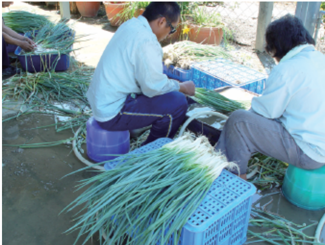
圖9. 採收後之清洗整理作業。

(七)採收:種植120天後，亦即第2次培土後30-35日，可視生育情形陸續進行採收(圖9、10)。