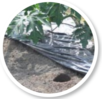
圖18. 鑽孔穴施再覆土可減少雨水將肥料淋洗流失

在夏、秋雨季期間，間歇性降雨往往長達數週之久，此外又常有颱風威脅，因此施肥與否及如何施肥常成為農民最難拿捏之部分，一般定植後之木瓜，最常見之施肥方式，即於畦腰部分進行表面條施，但在雨季階段，畦腰條施易造成肥料之流失，因此穴施方式能有效避免肥份流失(圖18)，而其作法則是在梅雨季節來臨前1-2週，利用鑽孔機在樹冠四周鑽4-6個孔穴，直徑15-20公分，深約40-50公分，然後可