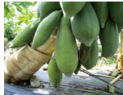
圖8. 倒株造成低結果節位果實感染疫病