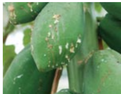
圖19. 發生木瓜缺硼病徵前果實會有乳汁進出現象

木瓜為持續開花結果及週年均可生產之作物，合理的施肥管理，能避免農民生產成本不必要的支出，更可提升農產品品質及避免環境生態污染，達到作物健康管理之目標，且在目前國際肥料價格不斷調整情勢下，為提昇農業競爭力之不二法門，而依據土壤肥力檢測與植物體營養診斷結果來推薦，適時、適量提供作物生長所需養分，則更能達成合理化施肥目標，為提升農產品質、產量與兼顧農家收益的最有效途徑，且能維持良好之農業生產環境及永續農業之發展。