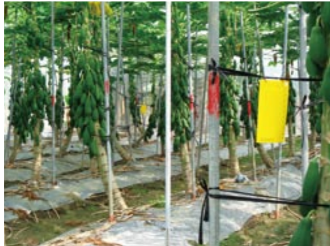
圖33. 應用黃色黏板可做為園區監測或防治害蟲的資材