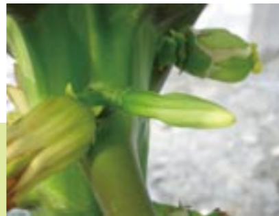
圖2. 左 / 木瓜兩性花的偏雌花花形，較為圓胖。中 / 木瓜兩性花的正常型花花形。右 / 木瓜兩性花的偏雄花花形，基部因子房退化較為瘦小。