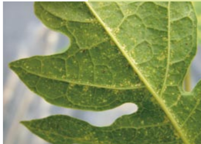
圖30. 上 / 木瓜葉片上二點葉蟎放大圖；下 / 木瓜葉片遭紅蜘蛛危害情形。