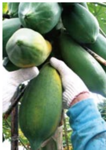
圖13. 木瓜採收：一手托起木瓜，一手深入果頂處推折採收。