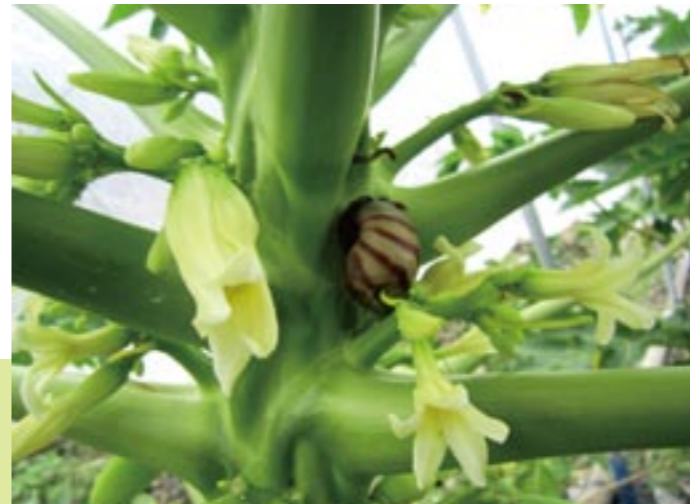
圖31. 躲藏於木植株上的非洲大蝸牛，常會取食嫩心與花蕊。

一般蝸牛於低溫乾旱環境可藏入隱蔽處，殼口分泌白膜自行封閉，藉以抗爭不良氣候，待氣候適宜，隨即活動取食，成蝸及幼蝸都有晝伏夜出習性，晝間藏於陰暗處，已爬至木瓜株上者，則藏於木瓜果實之空隙，夜間出來食害幼苗或爬至木瓜株上食害嫩心、花蕾 (圖31)。雨季時發生嚴重，不但污染果實，並且容易導至果實疫病發生，影響木瓜產量和品質。