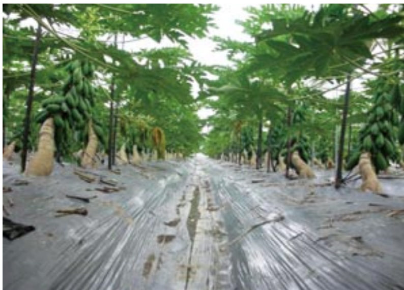
圖5. 深溝加強排水是木瓜高產獲利的保證