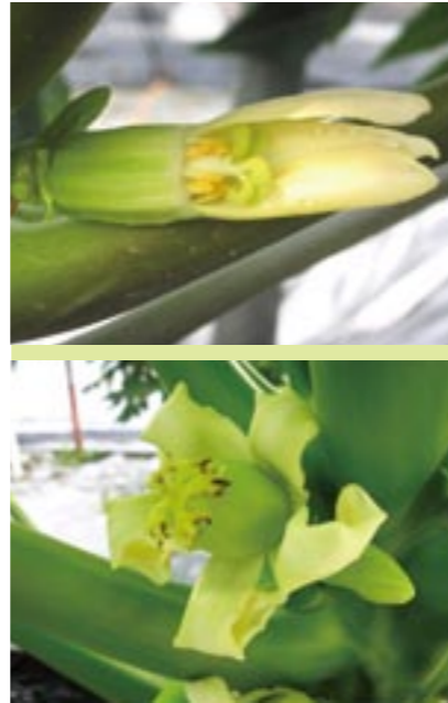
圖1. 上 / 木瓜兩性花，具有雄蕊與雌蕊。下 / 木瓜雌性花，只有雌蕊。