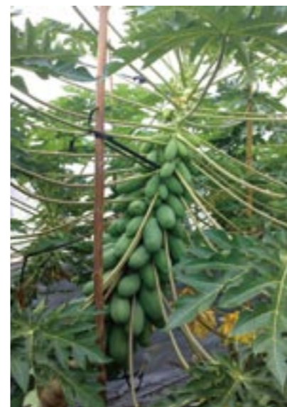
圖12. 木瓜立支柱及綁縛方式

立支柱目的為防止植株因負載過多果實而倒伏，支柱的資材一般為竹子，直徑粗約6-10公分，長度約3公尺，也有部分農民使用鋁管，優點是可以重複利用，但缺點為所需成本較高且較重。使用竹子做為支柱時，可利用馬達式的鑽孔機鑽孔，深度約0.6公尺，埋入土內的竹子必須塗上柏油，以避免腐爛。支柱一般位於倒株的相反方向(樹幹彎曲內側)，支柱可略微斜插約20度，再利用塑膠繩綁縛支柱與樹幹，一般綁縛位置至少要有二處，以分散植株重量，待植株生長後再陸續往上綁縛(圖12)。立支柱時間務必在雨季來臨前進行，因為雨季來臨時，鑽孔所造成的根部傷口易造成感染，且土壤易鬆動支柱不易牢固。