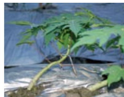
圖9. 木瓜在苗期時以拉倒方式倒株對根系傷害小