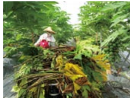
圖22. 木瓜果園清園可減少病害感染源

囊與游走子可藉風雨吹送、或小動物之攜帶至果實或其他果園，侵入感染，誘發病害。疫病菌感染幼嫩組織或果實，不一定需要傷口，但有傷口時，病菌侵入更易。