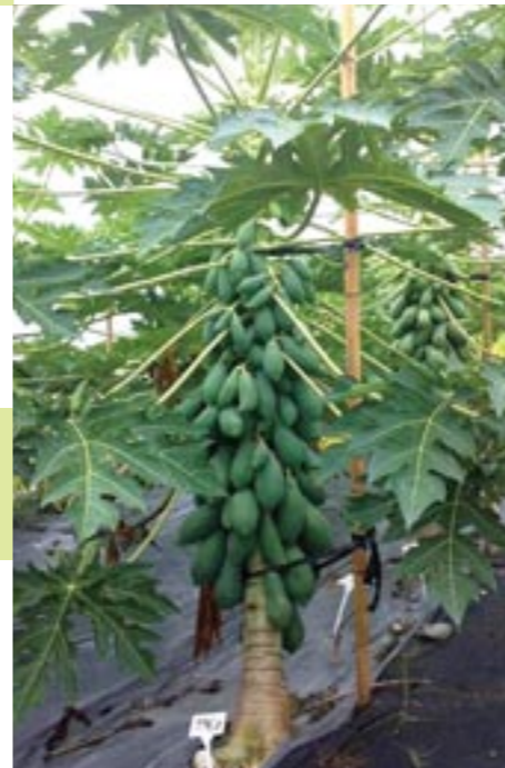
圖3. 台農2號植株田間生長情形

升，月平均交易量約2,100公噸，月均價30.5元/公斤，並且在每年的9月到隔年的3月，均可維持一定的高價，主要因為木瓜生產量受豪雨影響而無法補足。近年來所造成的巨大豪雨量，均為數十年僅見，未來氣候變遷將日趨劇烈，颱風豪雨也變得更不可預測，對於木瓜栽培者而言，挑戰將日趨嚴厲。因此木瓜栽培獲利的關鍵在於，如何在劇烈的颱風豪雨季節中保全植株，並進行健康管理，以達到生產安全、優質及穩定生產的目標。