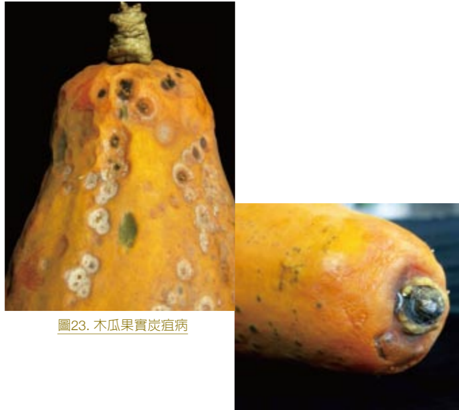
圖23. 木瓜果實炭疽病

危害木瓜之樹幹、葉柄及採收後之果實，其中以果實最易受害，果實病徵多由果柄處開始出現，故名蒂腐病(圖24)，若有機械傷害傷口時，病原菌也易由傷口處侵入，傷口處初期果實呈軟化、水浸狀，高溫嚴重時病斑部有白色菌絲，後轉為灰綠色，菌絲生長快速，造成全果腐爛。樹幹病徵，初期樹幹皮層呈水漬狀、不規則病斑，後期纖維化，樹葉乾枯脫落，終至全株死亡。