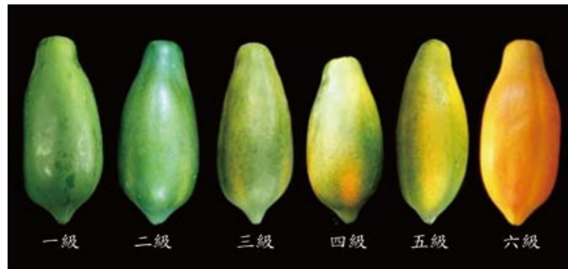
圖14. 木瓜果實成熟度分級標準