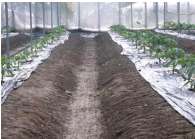
圖17. 雨季期間覆蓋資材適時翻開通氣可減緩土壤酸化現象

影響木瓜生長所需營養要素失衡。此外，在颱風或連續大雨過後，土壤含水率高，不透氣資材覆蓋易加劇土壤通氣不良，而發生厭氧狀況，將會影響植物根部呼吸作用，對根部造成傷害。因此，於環境高溫及雨季期間，畦面覆蓋不透氣資材，需多加注意土壤之透氣性，適時將覆蓋資材翻開，使土壤通氣，將可減緩土壤酸化與厭氧狀況發生(圖17)。此外，如成本考量允許，建議可選擇具有透氣性之覆蓋資材，將可減緩上述情況發生。