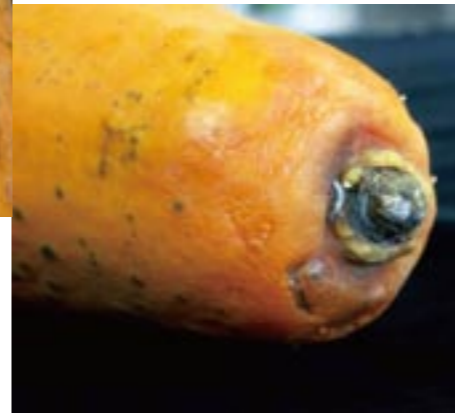
圖24. 木瓜果實蒂腐病