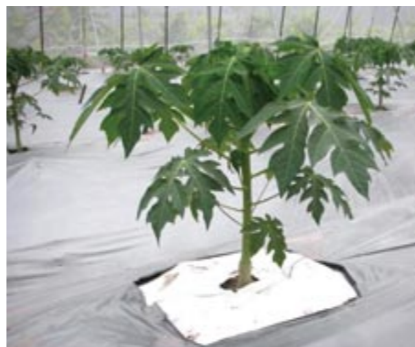
圖7. 以泰維克布取代部分土壤覆蓋的作法

建議以銀黑色塑膠布作全面性果園覆蓋，若定植日期在10月至隔年3月，可在塑膠布上挖取直徑約15-20公分的植穴定植木瓜苗，對於木瓜苗生育具有正面的效果。但若在高