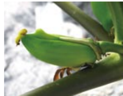
圖11. 木瓜偏雌花所著生的畸形果，宜儘早去除。

在開花期間，便可逐步將偏雌花割除；結果期間，也可割除畸形果(圖11)，此外應隨時將授粉不良、形狀不佳、病蟲害果和過度擁擠的果實儘早摘除。