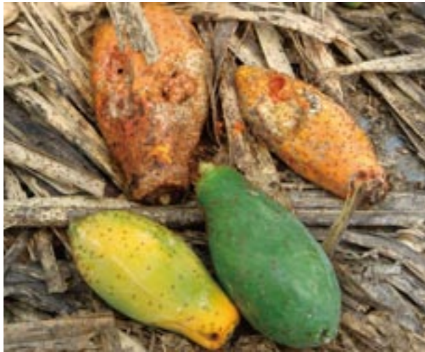
圖32. 受害果任意丟棄園區易成為病原菌與害蟲孳生繁衍的根源