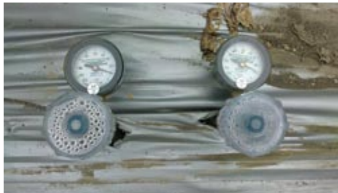
圖10. 可利用土壤水分張力計作為灌溉指標

灌溉水量不應該以天數來決定頻率，必須要視作物的生長季節及時期來決定水分需求，為使水分管理更為準確，可利用土壤水分張力計來評估土壤水分狀況。一般而言，以木瓜根系深約70-90公分計算，可以埋設30、60、90公分深度的土壤水分張力計(圖10)，以瞭解灌溉前後土壤水分張力的變化。以土壤水分張力15至30分巴，為適當土壤水分狀況，數字越接近0表示土壤中水分越多反之，則水分越少；木瓜在中果期以前，大部分根群所在的位置大約在0-45公分，因此可觀察30至60公分深度水分張力計，當讀值超過30分巴時開始灌溉，接近採收期則可讓土壤水分張力接近50分巴才開始灌溉，如此將有助於徒長的抑制及果實糖度的累積。