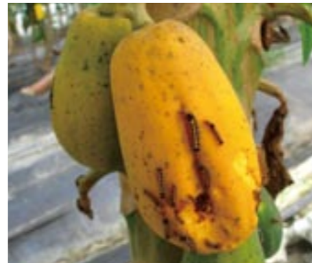
圖28. 台灣黃毒蛾為木瓜園常見蛾類害蟲，除啃食葉片亦可危害果實，亦常造成園區工作人員過敏反應。

隸屬於雙翅目 (Diptera)、果實蠅科 (Tephritidae)、背寡毛果實蠅屬 ( Bactrocera ) 的害蟲 (圖29)，為世界重要檢疫害蟲，外銷之鮮果常因為防範此蟲擴散或侵入，需經蒸熱檢疫處理過程才能進入非疫區國家。此蟲在台灣有紀錄者可危害達90種以上的寄主果實，雌成蟲產卵於果皮內，每一雌成蟲約可產下120-150個卵，孵化之幼蟲蛀食果肉部分，導致果實腐爛或提早落果，除偏好危害成熟果，亦具有危害未成熟果的能力，而採收後果實於運送途中應嚴加防範果實蠅伺機危害。幼蟲期約10-12天，老熟幼蟲從受害果彈跳至附近土裡化蛹，平均蛹期約12-14天，整個生活史約在22-28天可完成。