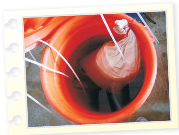
堆肥茶湯製作前之情形