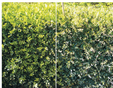
堆肥茶湯應用於七里香白粉病防治，效果顯著（圖左），圖右為對照處理(未防治)。

由於施用固態堆肥後，需經歷較長時間才可發揮肥效，效率緩慢，尤其是短期作物使用上較不便。堆肥茶湯由堆肥經24~72小時萃取而來，堆肥中大部分的水溶性養分可被溶至茶湯當中，其對於各類食用作物、花卉及草皮可有效的供應養分，方便庭院、公園及球場等綠地植栽的維護。除養分供應之外，對於作物葉面及根部病害具有抑制的效果。已有研究報導，堆肥茶湯對於Pythium所引起的苗期猝