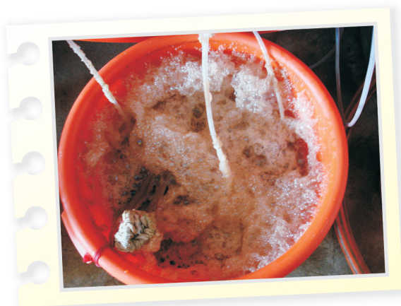
經過24小時發酵後，製作完成之堆肥茶湯。