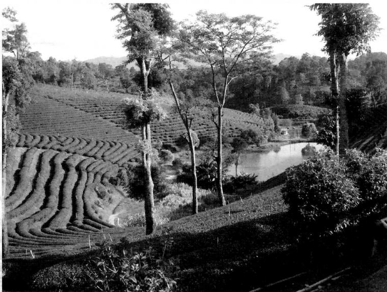
玲瓏有緻的茶園，頗具觀光潛力

回憶往事，當年和台灣斷了聯繫的「滇緬邊區的游擊隊」第3軍和第5軍，猶如亞細亞的孤兒，斷了線的風箏，掉落在泰北的崇山峻嶺之中。如今，這兩只斷了線，掉落在崇山峻嶺之中的風箏，又再度飛了起來。