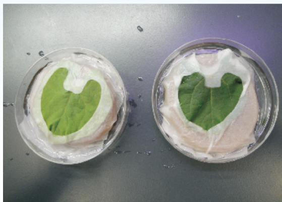
圖6. 利用培養皿及青皮豆葉片飼育葉蠶。

的生活史，同時可以在實驗室進行葉蠶雜交，確認是否為同種等相關研究，做為葉蠶分類參考依據。