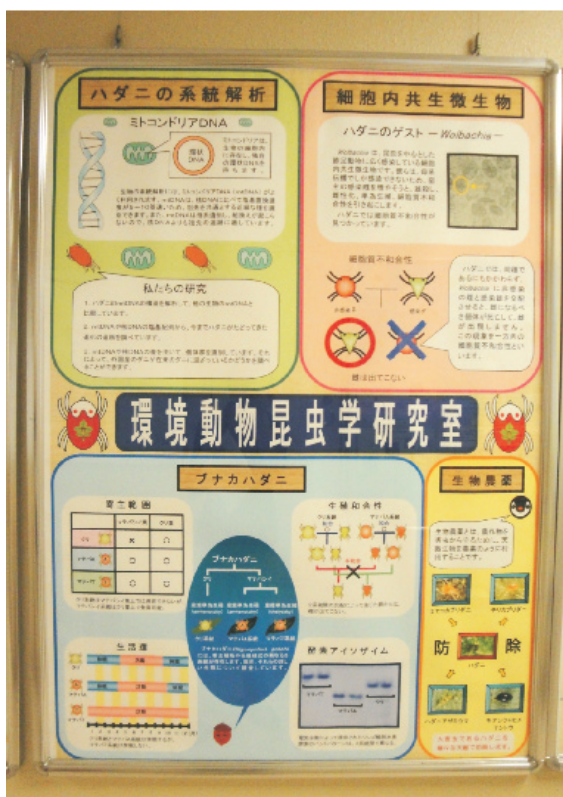
圖2. 研究成果製成海報展示於研究室走廊，供研究人員及民眾參考。

屬、 Schizotetranychus 屬等，並已建立葉蟎屬（ Tetranychus ）的酵素圖譜（Zymogram）鑑定資料。此外，該研究