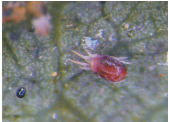
圖3. 雌成蟎於葉背取食造成為害。

蟎類酵素圖譜與DNA分子鑑定技術。以酵素圖譜或DNA分子技術做為鑑定工具，其優點在於可輕易區別不易以外部形態鑑別的近似種，不必費及費工將葉蟎製成玻片標本，且一次可鑑定較多的樣品數；但如要使用此類方法，必須有已知種做為比對樣品 (Marker)。因此，蟎類鑑定仍以形態特徵為主、分子技術為輔，以確保鑑定的準確率。