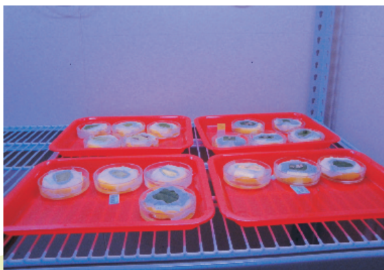
圖5. 實驗室內葉蠶飼養方法，節省空間。

實驗室內葉蠶飼養的方法，主要考量以有限的空間、可飼養多種葉蠶及方便用於分類鑑定之研究等為原則；日本開發以桑葉及豆科植物葉片為飼料，培養皿為飼育容器，並於培養皿注滿水防止葉蠶逃逸的簡便方法，可節省空間（圖5、圖6）；但較為耗時，必須每日確認培養皿水量及葉片品質，否則容易失敗。利用此法不僅可以觀察各種葉蠶