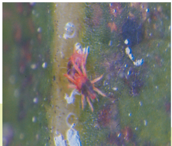
圖4. 雄成蟎守候雌成蟎，待雌成蟎羽化後交尾。