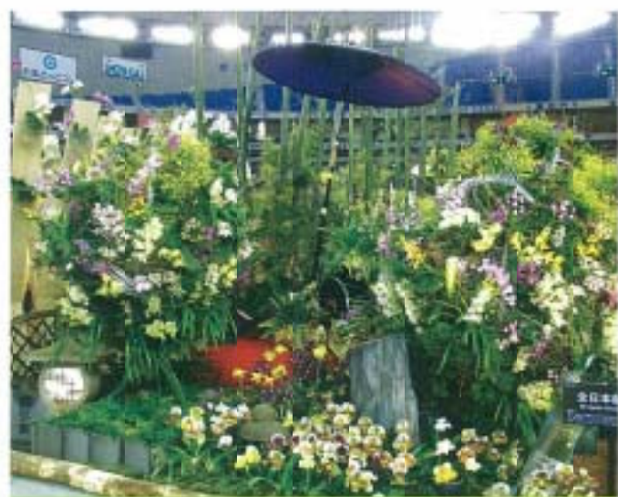
▲ 全日本蘭協之景觀佈置

日本蘭展的展場內沒有任何販售飲食的攤位，飲食的販售只在入口處及休息區，因為展場內「禁止飲食」。反觀台灣的國際蘭展，展場內不時的飄逸著烤魷魚、咖啡或是叫賣飲食的聲音，雖然大會已將飲食區隔離，又一直透過廣播告訴大眾「展場內禁止飲食」，但仍會看到手拿冰淇淋、飲料或是食物邊走邊吃的人，不禁令人莞爾——「主角是誰？」，有關這點，台灣民眾還有待加強！！