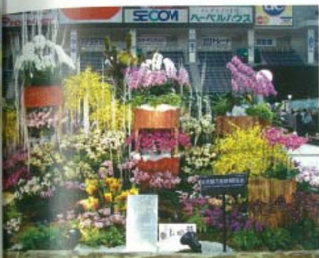
▲ 台灣蘭花產銷發展協會之「蘭島風彩」 (獎勵賞)