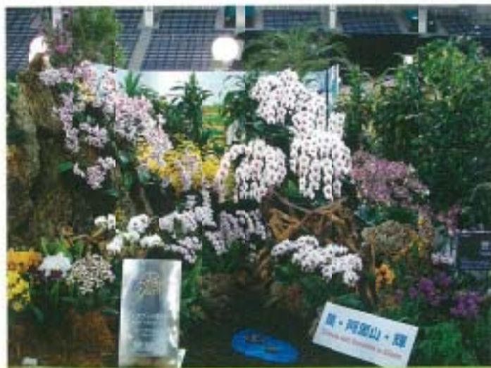
▲ 台大蘭園之「蘭·阿羅山·輝」 (獎勵賞)

個體花品種展示與競賽方面，除分為日本大賞及個別審查部門、東洋蘭及日本の蘭（即蝴蝶蘭屬及其群屬、嘉德麗雅蘭屬及其群屬、仙履蘭屬及其群屬、石斛蘭屬及其群屬、其他蘭屬等五個主要屬別）審查部門外，更另闢一個「具芳香」的東洋蘭審查部門。