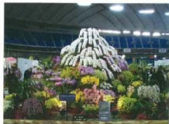
▲ 日本花き生産協會羊らん部會東日本支部之景觀佈置(獎勵賞)