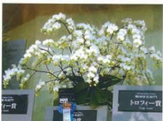
▲ 受蘭園獲得個體審核C. C. M.獎(栽培獎)殊榮之「Phai. Ho's Amy Christopher 'Hanano-En'」