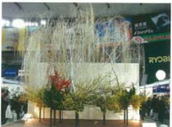
▲ 日本插花六大流派之一「草月流」之花藝設計