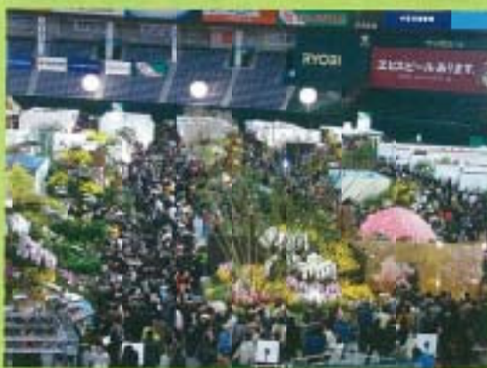
▲ 2006年日本世界蘭展之盛況

蝴蝶蘭為台灣四大旗艦農產品之一，深具外銷潛力，近年來日本為台灣最大的出口市場，業界普遍認為仍有成長的空間；台灣蘭花產銷發展協會為協助台灣蘭花業者尋求更多的商機，於2月組成拓銷團前往日本參訪。拓銷團的主要行程為參觀2006年日本東京巨蛋蘭展、日本最大花卉拍賣市場—大田花市及與日本相關業者舉行交流座談會，以進一步瞭解日本對蝴蝶蘭的需求與相關配套措施。筆者欲將本次拓銷團的參訪內容逐次為各位做簡要的報導。