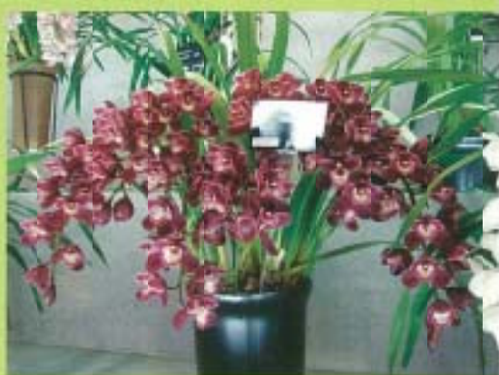
▲ 目前極受日本市場歡迎之下垂型虎頭蘭