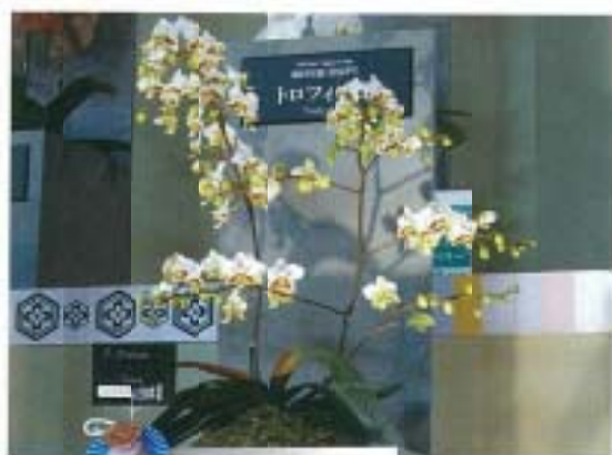
▲ 台糖公司精農事業部獲得蝴蝶蘭組冠軍及個體審核B.M.獎(銅牌獎)兩項殊榮之「Phai. Ho's Amy 'Taisuco'」