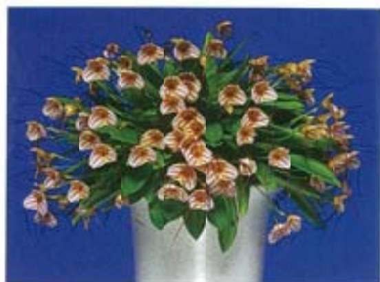
▲ 2006日本世界園展日本大賞之「Masd. Tuakau Candy 'Loveily'」