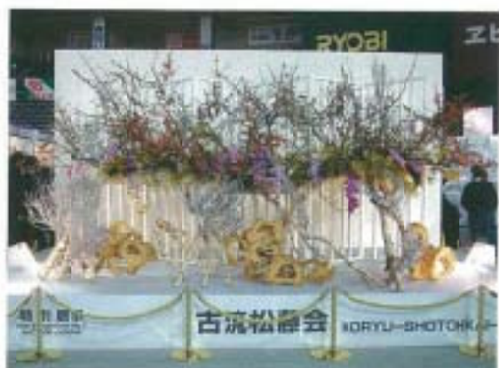
▲ 日本插花六大流派之一「古流松藤會」之花藝設計