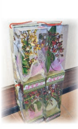
圖2. 明翠谷蘭園與台糖合作開發的文心蘭盆花禮盒