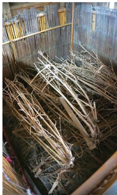
以中空的刺竹網來捉魚，是族人的生活智慧。

這種捉魚的方式與光復馬太鞍的「巴拉告」頗為相似，不過他強調，撒奇萊雅族比阿美族更早採用這種方式，而且早期整個美崙溪到出海口，全都佈滿了這種刺竹網，每一家都會放置好幾個，是族人非常拈熟的捉魚方式。