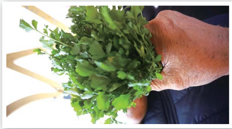
生長在海邊的耳托，有股非常濃厚的芥菜味。