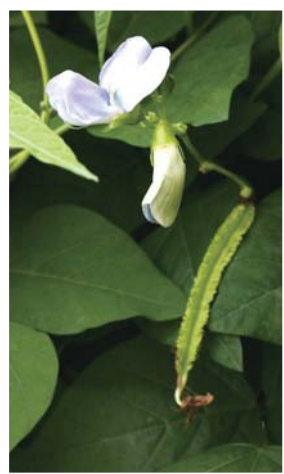
長著四個邊角的翼豆，有點像是會飛起來的感覺。