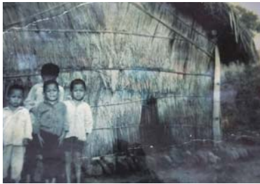
早期撒奇萊雅族的生活一景。 (上・翻拍自國福養生園區) 早期族人所居住的茅草屋。 (下・翻拍自撒固兒部落教室)