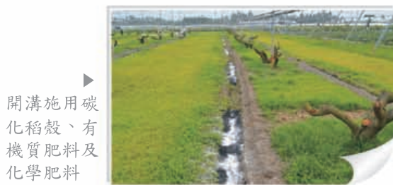
▶ 開溝施用碳化稻殼、有機質肥料及化學肥料

碳化稻殼除了可作為鉀肥來源之外，因表面富含官能基，可做為吸持營養元素之載體以提供作物根系生長之溫床，故建議於施用基肥時，可與有機質肥料或有機資材、化學肥料一同使用，碳化稻殼施用量建議每分地約為100-200公斤，施用區域為根圈附近，施用方法為開溝使用，以碳化稻殼為底，有機質肥料施灑於碳化稻殼之上方，上方再撒施化學肥料，最後進行覆土之動作，此法可減少化學肥料之流失，提高作物對於化學肥料之利用效率，追肥時如能搭配液肥施用於基肥施用區域，將可獲得更佳之效果，唯碳化稻殼為鹼性之有機資材，故不宜施用在鹼性土壤中(pH>8以上)。碳化稻殼為不完全燃燒所生成之產物，且富含鉀、矽、微量元素等，燃燒過後的碳化稻殼在土壤中不易分解，如連續使用數年，則具有累積土壤有機碳之效果，不僅可改善土壤物理性質，同時可活化土壤，故建議連續數年少量累積使用，以維持土壤有機碳之含量，不但可培養樹勢及使植株健壯，且對果實品質及產量之提昇亦有所助益。