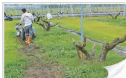
◀ 施用後進行覆土之動作