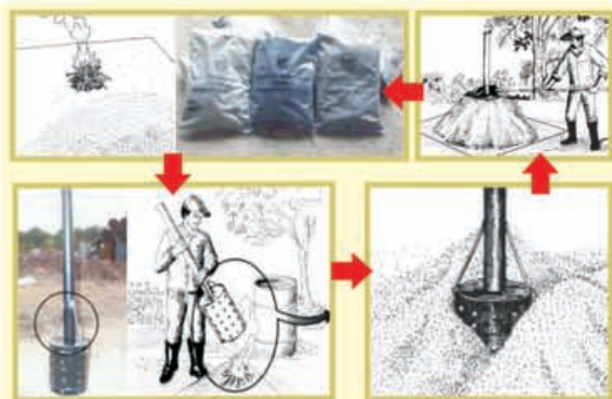
圖1.傳統土窯式燒製碳化稻殼之過程(摘自Asis et al., 2005)