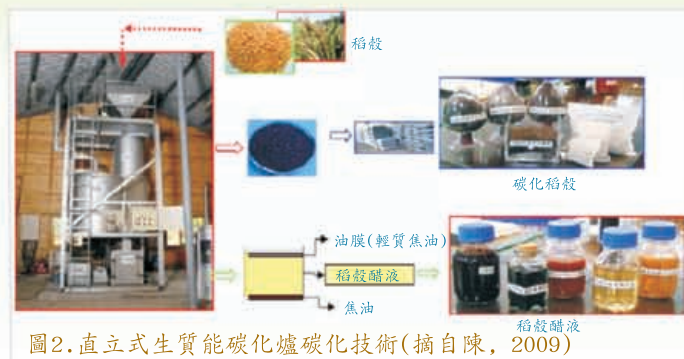
圖2. 直立式生質能碳化爐碳化技術(摘自陳, 2009)

碳化稻殼之製作方法目前可大致分為兩大類，一為傳統土窯式燒製而成，如圖1所示，此方式之生產器具成本較為低廉，可提供農民自行生產使用，但所獲得之碳化稻殼因生成溫度較不易固定，部分為有氣燃燒，所生成之碳化稻殼含有些許之灰分，所以純度較低，屬於低溫有氣環境下之燃燒；而另一種方式則為生質能碳化爐，如圖2所示，包括直立式生質能碳化爐及橫式生質能碳化爐，利用熱氣聚集在碳化爐中，有效節省碳化製程中所需熱能及時間，而因在定溫下生成，故所獲得之碳化稻殼純度較高，屬於高溫無氧或低溫無氧燃燒，相對於傳統土窯式燒製法，此方式之生產器具成本較為昂貴，多為工廠生產使用。