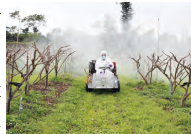
圖4.冬季修剪後預防性防治管理作業