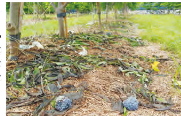
圖5.修剪後枝葉及病果勿棄置果園可減少二次感染機會