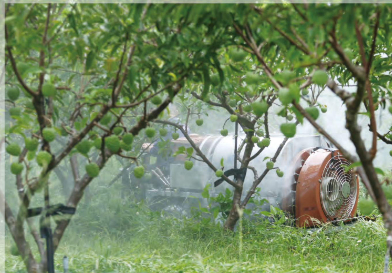
圖 / 文 陳奕君、王誌偉