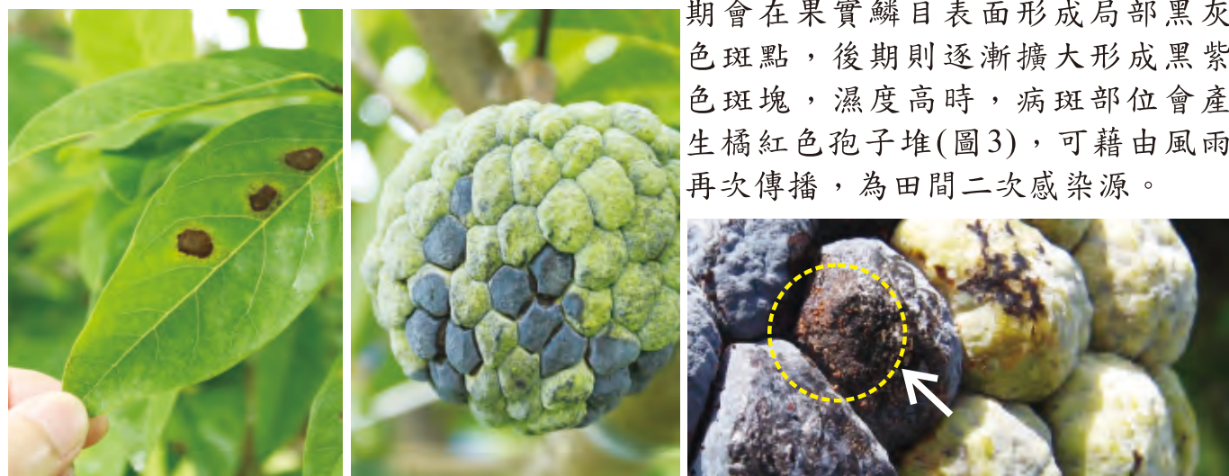
圖2.炭疽病為害番荔枝葉片(左)及果實(右)樣態 圖3.橘紅色孢子堆為田間二次感染源