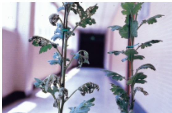
▲一般的菊花不耐蟲（左）及經過抗蟲基因改造過的菊花可以抗蟲（右）

農業科技進步的最終的旨在提高農民的收益、造福全體人類。假若 DNA 科技應用在農業上並無法達到上述的目的，那麼最終將會被遺棄。當我們將 DNA 科技應用於農業時，也要有所體認，這個技術不是無所不能的，它僅能解決部分的問題，而且這項技術的建立與發展是緩慢且需要長期投資的。最後，我們期待這項技術未來真的能對農業做出些許的貢獻，也希望大家能放開胸襟去迎接這個嶄新的基因世代。