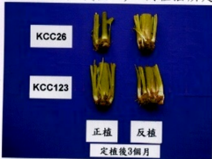
▲圖三：定植三個月後子芋發育情形

由圖二中可發現，以倒植方式定植三個月後種芋頂端由向下轉為橫向，再轉而向上發芽，側芽間隙較大，使側芽具有較大的生長空間。另外，各側芽的大小亦較正植者整齊。而以正植方式定植者，側芽集中且較擁擠，側芽大小亦不整齊(圖三)。在定植後七個月觀察球莖發育情形時(圖四)，倒植法所定