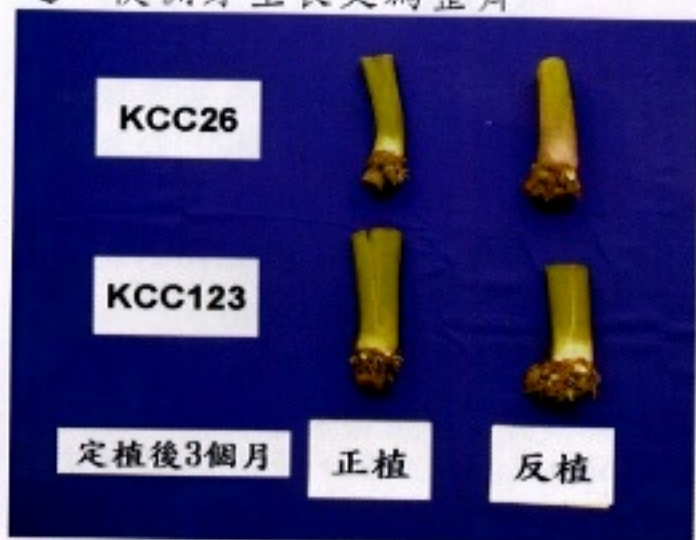
▲圖二：定植三個月後種芋(母芋)發育情形

方式定植會造成頂芽生長受抑制，發芽較遲緩，頂端優勢較弱，使側芽生長相對旺盛，生長勢與頂芽相近，使側芽生長更為整齊。