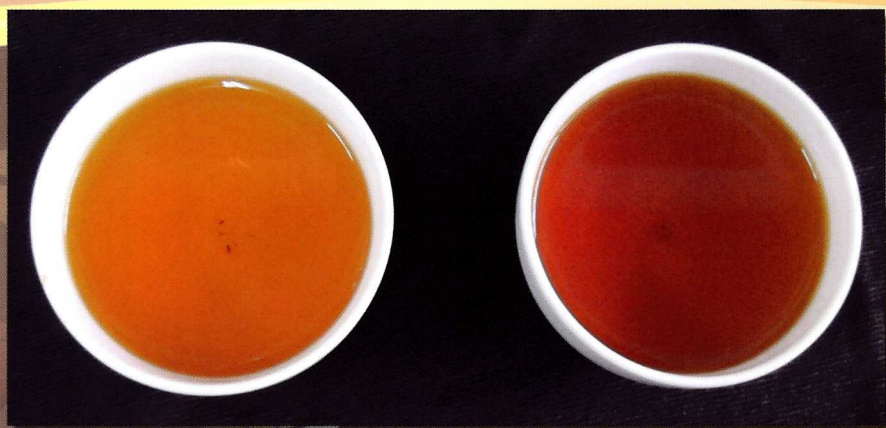
茶葉湯色 (左為臺茶18號，右為臺茶7號)