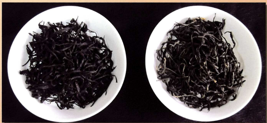
茶葉外觀 (左為臺茶18號，右為臺茶7號)

等到Shan茶種廣為大眾所喜愛，嚮往茶葉知識的人想跟東邦紅茶一樣追隨先人腳步溯源時，就會突然發現，到底臺灣的Shan茶種是屬於泰國清邁最北端之高山叢林的茶樹，還是在中國、寮國、泰國及緬甸交界的金三角地帶，有待考查。而且究竟是泰國Shan茶種、或緬甸的Burma種之一個支系，抑或是中國雲南大葉種之一，就此展開茶樹種原尋根的探討，那臺灣Shan茶種的故事續篇就更有趣了。