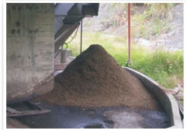
圖4. 選擇禽畜糞堆肥需注意其重金屬含量是否過高。

有機質肥料中禽畜糞特別需注意重金屬含量(圖4)，主因來自於動物飼料中常添加硫酸銅或鋅，而隨糞便代謝出體外，使其含有高量的銅或鋅。銅和鋅為植物必需的微量元素，適量施用有助於作物生長，但長期施用則易造成土壤重金屬累積，因此建議與植物性堆肥輪流使用，可減輕對土壤品質產生的危害。