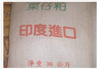
圖3. 複作次數高者，選擇速效的渣粕類等有機質肥料。

物質有機肥，使其肥分能快速分解利用；而多年生果樹，有機質肥料多用於基肥(果實採收後)階段進行，約每年施用1次，因此可選擇如太空包廢料、鋸木屑、花生殼、稻殼等含量較多，不易分解的有機質肥料施用，可達長期改善土壤理化性質功效。