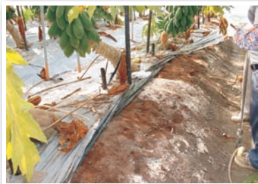
圖1. 施用未完全腐熟有機質肥料，白色菌體因吸收土壤中的營養而大量繁殖。

優質的有機質肥料，經過適當製程或堆肥化發酵腐熟後，體積較為膨鬆或顏色呈現黑褐色，且具有泥土或輕微霉味。但若有強烈刺鼻味或具惡臭味，則表示未完全腐熟，若施入土壤中易產生碳氮比失衡現象，並使微生物大量繁殖，從土壤中吸收營養進入菌體(圖1)，並大量利用氧氣，引起嫌氣性醱酵作用，產生不完全氧化的物質，並與作物競爭養分而影響其生長，對植物的根具有毒害及抑制作用。