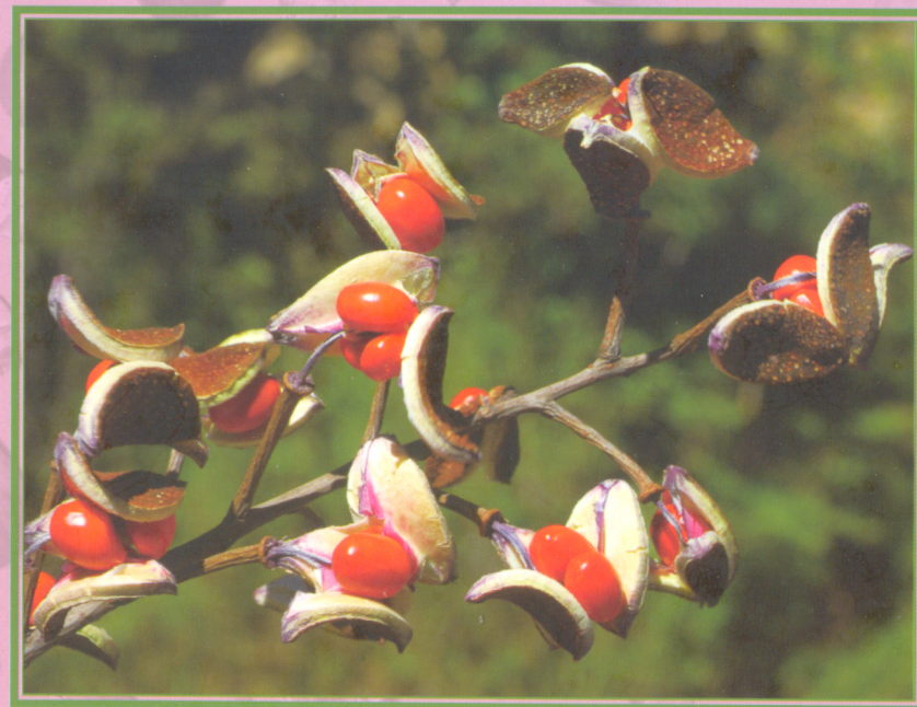
Bretschneidera sinensis Hemsl. 鐘萼木