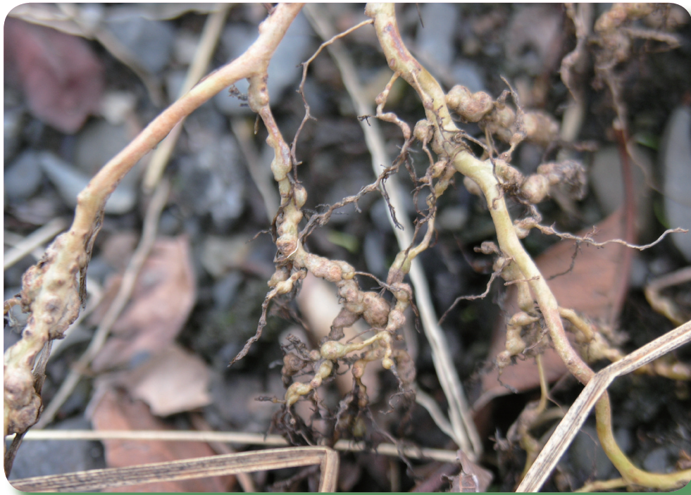
根系伸展不開，結瘤眾多，根瘤轉成黃褐色