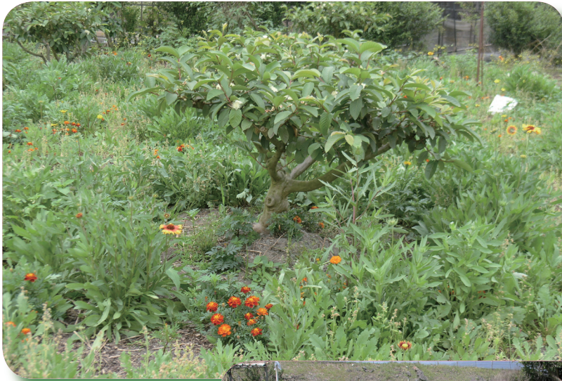
萬壽菊、孔雀草 或天人菊混植於 番石榴果園