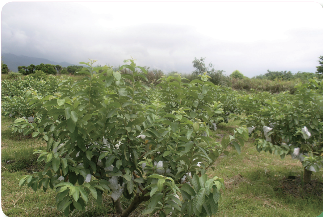
綜合處理後番石榴樹勢生長良好