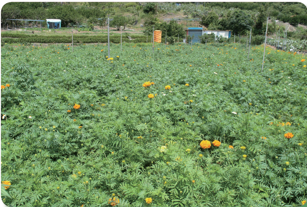
田區萬壽菊生長情形