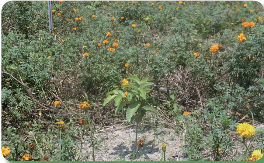
番石榴苗混植於萬壽菊花海中