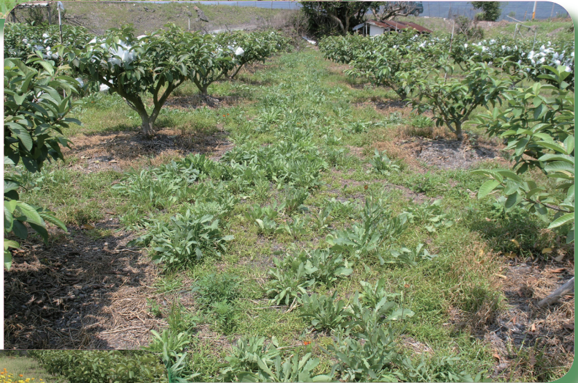
天人菊於果園生長情形