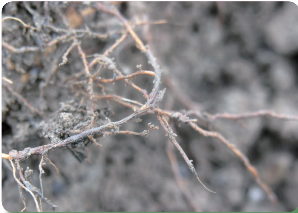
根系數量變少，破損，發育不良，無法輸送水分及養分