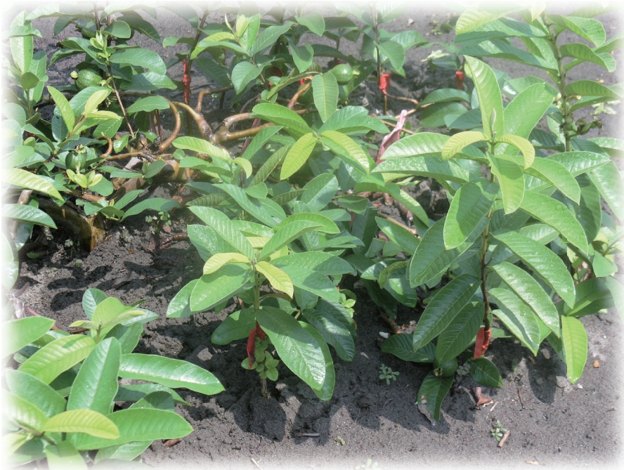
番石榴苗常見之壓條地面靠接繁殖法

根瘤線蟲病是植物寄生性線蟲病害中分佈廣泛且為害嚴重的世界性病害。第二齡幼蟲侵入寄主根部、刺食維管束周圍組織後，被害根部形成腫瘤，以致水分、養分之輸導受阻，被害植株發育受影響。為害番石榴的寄生性線蟲種類計有14屬，其中以根瘤線蟲( Meloidogyne spp.)所造成之為害最嚴重，以白拔感染比率最高，而梨仔拔及紅拔較輕微。