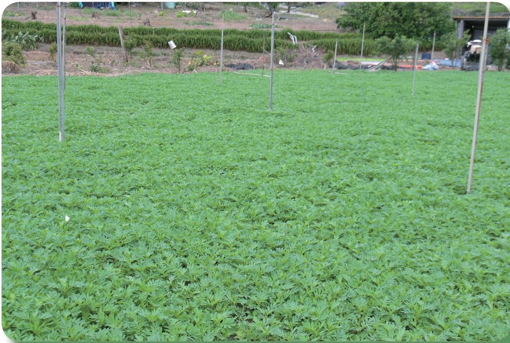
先將土壤添加物翻犁入土後再全面撒播萬壽菊