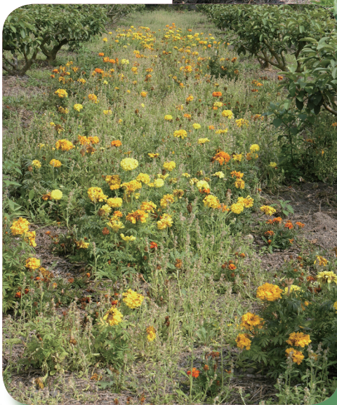
萬壽菊於果園生長情形