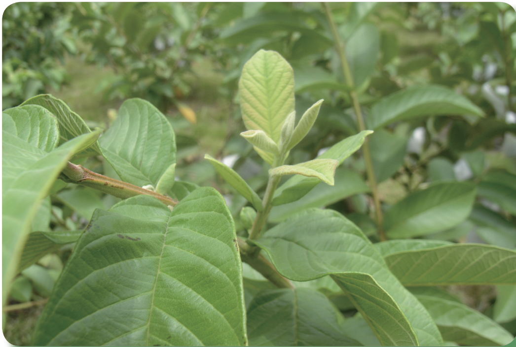
處理後新芽生長良好，新芽伸展不會呈縮水狀