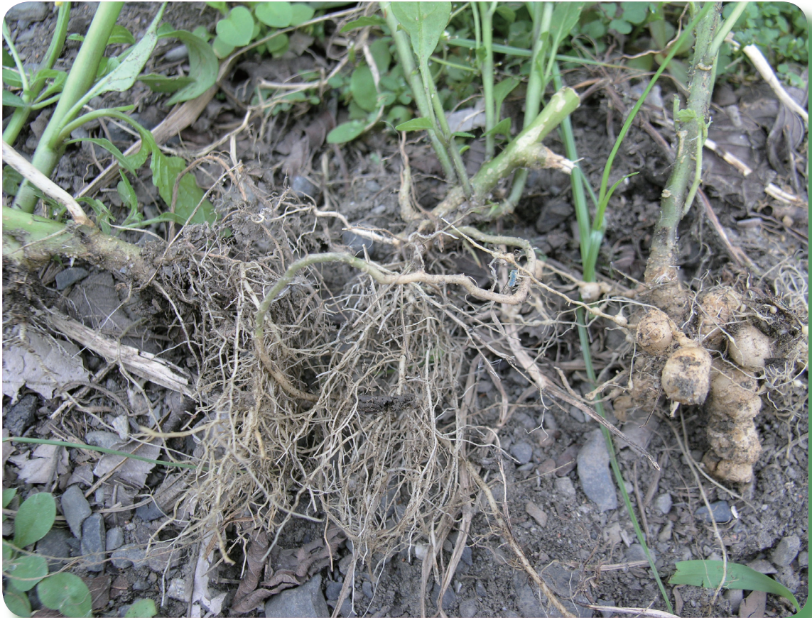
龍葵根部感染根瘤線蟲呈現瘤狀病徵