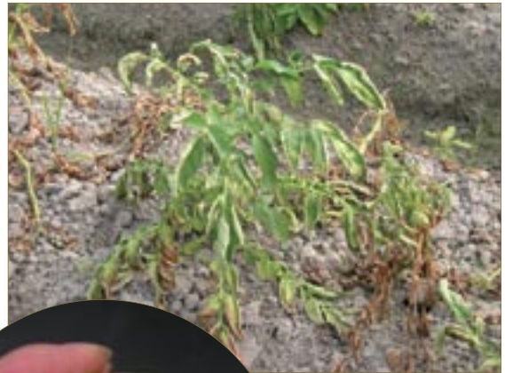
▲圖六、由馬鈴薯菌系引起之馬鈴薯青枯病病徵