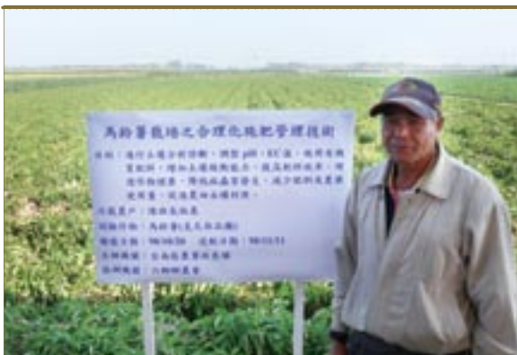
▲圖一、馬鈴薯合理化施肥示範田

綜合上述結果，依土壤檢驗報告，由專家進行客製化的馬鈴薯合理化施肥推薦量，將有最大施肥投資報酬率（以產值÷施肥成本計算），合理化施肥報酬率為19.5，一般推薦施肥報酬率為18.8，農民慣行施肥報酬率為9.8，故建議農友仍需將每塊田區分別採樣檢驗，並依檢驗結果進行土壤肥培管理。