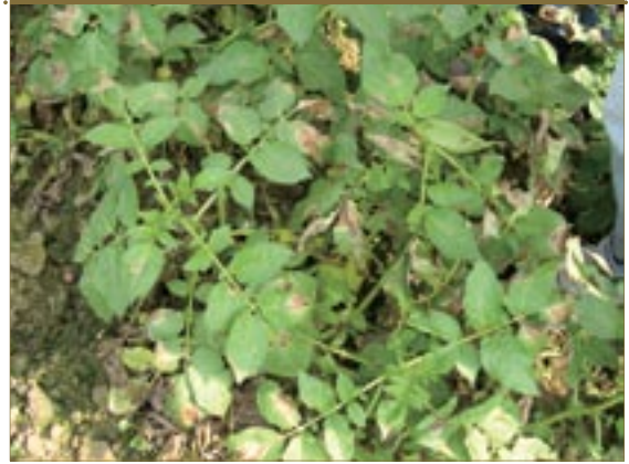
▲圖五、馬鈴薯晚疫病病徵

近年來田間發生的馬鈴薯青枯病已証實由兩種不同菌系所引發，一為高溫下致病的番茄菌系另一為低溫時才侵染馬鈴薯的馬鈴薯菌系。本病原菌為土棲性細菌，病原細菌由植株根部傷口侵染後，進入維管束，造成維管束褐變，引起地上部植株失水萎凋如青枯狀。褐變的莖部維管束用手擠壓有白色黏狀物溢出，若將放入清水中，可觀察到白色煙雲狀物由切口散出，為本病害簡易診斷法之一。病原細菌藉根對根或灌溉水傳