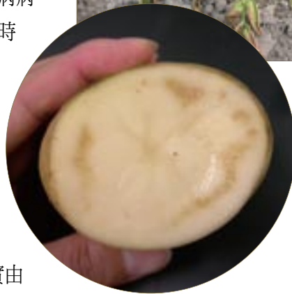
◀圖七、由馬鈴薯菌系引起之馬鈴薯青枯病薯塊褐化病徵