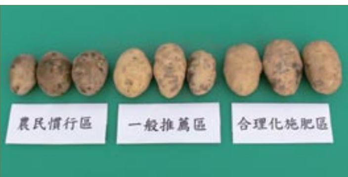
▼圖三、合理化施肥區（圖右）較一般推薦區（圖中）及農民慣行區（圖左）塊莖產量高