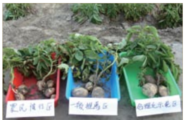
▲圖四、農民慣行區（圖左）較一般推薦區（圖中）及合理化施肥區（圖右）植株矮小且生育後期罹患晚疫病嚴重