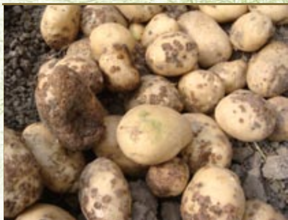
▲圖八、馬鈴薯瘡痂病病徵