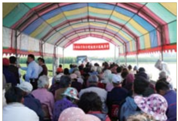
▶圖二、馬鈴薯合理化施肥田間成果觀摩會