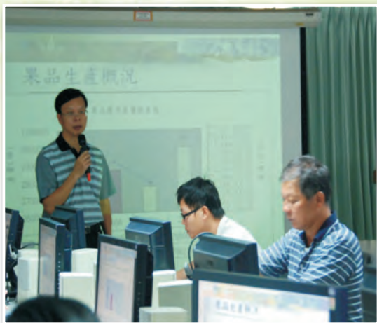
本場林場長學詩主持開訓及學員參訓上課狀況