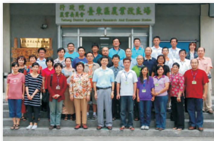
林場長與學員團體合照