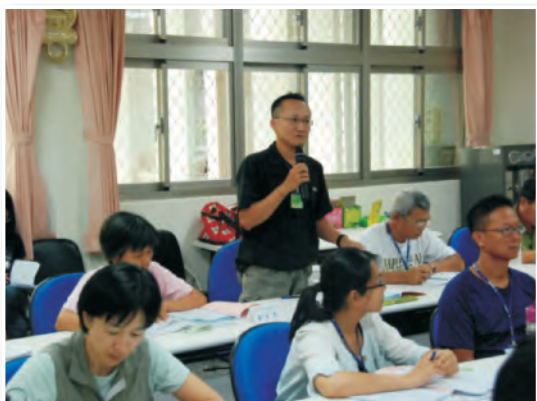
學員發表結訓感言