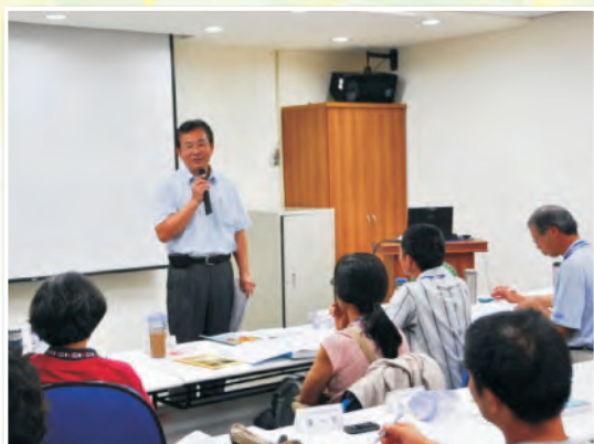
陳副場長信言開訓時，預祝學員滿載而歸，並提升農業新知。