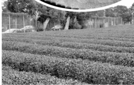
圖一、茶園受蟲害危害之情形