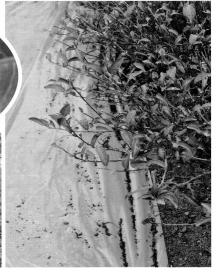
圖三、茶樹受危害之樹冠下遍佈蟲糞

三點斑刺蛾 Darna furva (Wileman, 1911)，屬鱗翅目 (Lepidoptera)，異角亞目 (Heterocera)，刺蛾科中小型，成蟲翅膀寬廣，前翅灰褐色密布褐色鱗，中央有一條黑色的斜紋但不及前緣，中室端有一枚眉型的橫斑，內側具黃褐色橫斑，亞外緣線黑褐色，近頂角於前緣上有一枚不明顯的黃褐色斑，體長1公分（圖四）。本種分布於低海拔山區，幼蟲頭部黑色，胸背面灰白色，腹背黑色，體背中央有一條白色的縱紋，腹側具褐色及黃綠色的長棘刺。取食範圍廣，包括無患子、沙朴、軟毛柿、柚子、捲瓣朱槿等。籲請各位農友注意本害蟲的發生，若發生可依登記核准使用於茶蠶或捲葉蛾類的藥劑作防治。