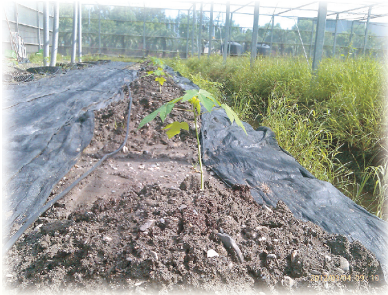
▲圖 11. 容易淹水區域木瓜苗應定植於土丘中

定植時可先在植穴附近，施加3～5公克緩效肥(如好康多1號，魔肥等)，與表土稍加攪拌後，挖開植穴將木瓜苗置入，埋覆土團時避免太深，以土團比根莖交界土面稍低約2～3公分為原則，定植後應立刻澆水，灌溉水可添加開根劑(如B1)及殺菌劑，之後每隔2～3天澆一次，約1週新葉展開後，再逐漸延長澆水時間。