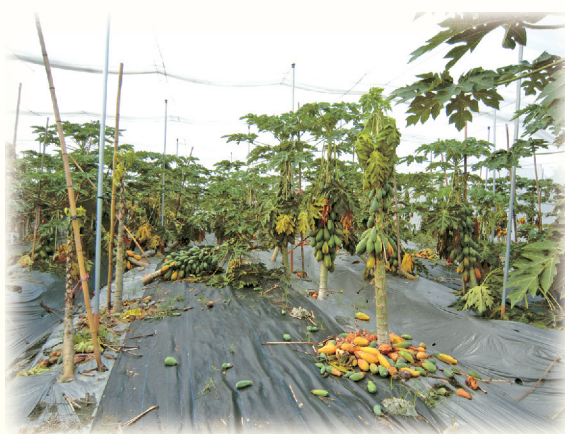
▲圖2. 夏季果實負載過大易造成果實脫落

秋植的木瓜於定植後約7~9個月開始採收，採收期將遇到夏季豪雨與颱風，由於大量果實負載必須要有足夠的碳源提供，但夏季的颱風豪雨經常造成葉片損傷，根系泡水死亡，影響其光合作用能力，因此果實負載量較大的植株，通常較不利於對抗颱風豪雨逆境(圖2)，也容易遭受果實貯藏性病害(炭疽病、蒂腐病及疫病)的侵襲，因此5~8月份最容易發生市場到貨量暴增，且果實品質參差不齊問題，經常價格嚴重低落更不敷成本。