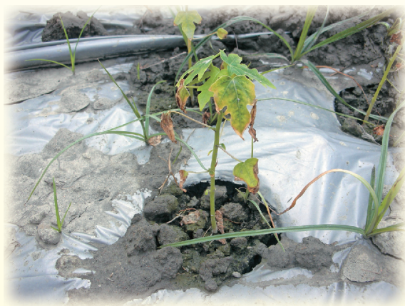
▲圖3. 傳統覆蓋法於夏季易造成木瓜苗受熱傷害、死亡率高。

主要傳統覆蓋資材為銀黑或黑色塑膠布，方法為在植穴位置挖取直徑約15～20公分圓洞，再將木瓜苗定植於其中。塑膠布覆蓋的主要功能為防治雜草，並維持冬季土溫，夏季則可避免豪雨直接沖刷根部，造成根群附近土壤及養分流失。一般而言，塑膠布覆蓋在冬季對木瓜的生長較為正面，但在夏季則易造成土壤溫度上升，豪雨過後土壤水分不易散失等問題，嚴重則影響木瓜生育，甚至造成植株死亡(圖3)。