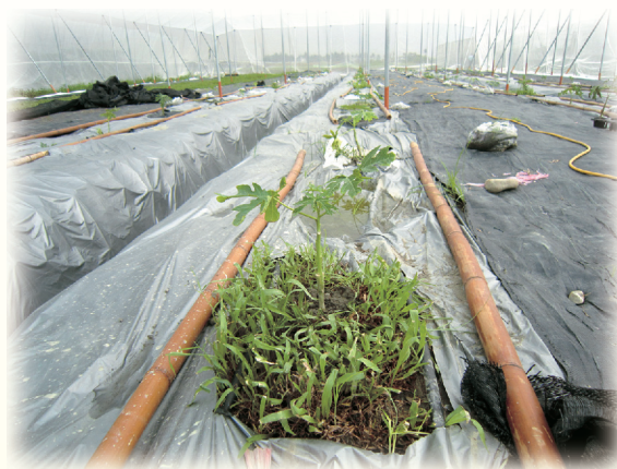
▲圖7. 於植穴周圍植草有助於降低土溫