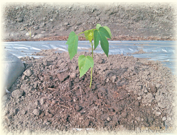
▲圖4. 木瓜加大植穴作法

傳統覆蓋方式在植穴周圍，塑膠布與土面間隙長時間日曬下會形成熱蒸氣的效應，濕熱的蒸氣容易造成植株的死亡與病菌滋生。為改善上述缺點，可將塑膠布上的植穴加大為50~60公分見方(圖4)，使根圈附近形成裸地效果，增加土壤通氣及水分蒸發量，缺點為根圈附近土壤易缺水，且雨水直接沖刷根部，雜草容易叢生等問題。