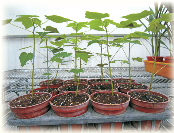
▲圖10. 木瓜組培苗通常需要健化

控制始果高度；利用組培苗也可以有效降低始果高度，但是必須注意，多數的組培苗從苗場出苗後，通常較為羸弱徒長(圖10)，因此可利用低水分及高光線管理加以馴化後再行種植，或待植株稍大後，剪除植株上部使其萌發新頂芽，也可以達到健化的目的。