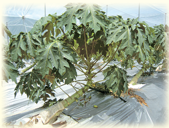
▲圖12. 倒株後以報紙覆蓋避免莖日燒

進行倒株栽培必須注意，當倒株後莖幹失去樹冠層葉片的保護，容易造成曬傷，因此可利用報紙加殺菌劑覆蓋(圖12)，可同時避免傷口腐爛。此外，夏季木瓜苗生育較弱，應儘量避免傷害其根系及葉片，倒株的時間也儘量選擇在陰天進行，完成倒株後還是需要以塑膠繩牽引，並以竹竿加以固定，植株主莖與地面約呈30~45°。