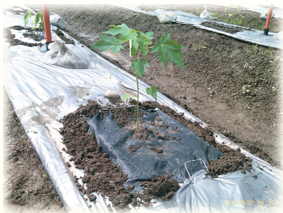
▲圖6. 利用防草蓆進行替代性覆蓋

實施方法為利用替代式鋪設方法，方法先將畦面以銀黑色塑膠布進行全面覆蓋，在定植位置之塑膠布上挖約60×60公分見方的開口，開口處鋪設70×70公分替代覆蓋資材，待木瓜樹冠成蔭後，對根部便有降溫效果。