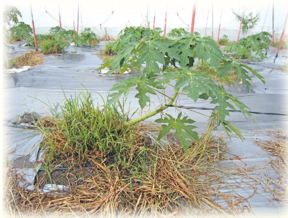
▲圖5. 利用植穴附近雜草以排除雨季土壤水分

解決辦法為於定植初期加強灌溉及肥培管理，植穴附近的雜草，除大型闊葉及牛筋草等雜草需拔除外，其餘雜草應避免拔除，但需注意雜草的修剪，可利用雜草調節植穴附近土壤水份並降低溫度，以增加木瓜苗存活(圖5)。