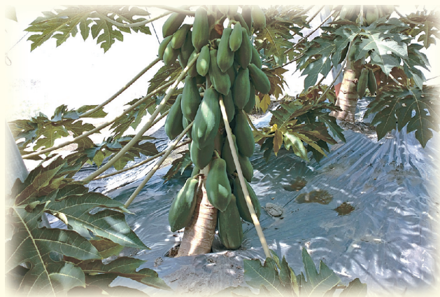
▲圖9. 嫁接苗始果高度相對較低

通常嫁接苗、實生苗及組培苗均可以使用，扦插苗除非根系十分強健，否則不推薦使用。使用嫁接苗的好處為植株成熟度較高，根系較完整，由於夏季苗容易徒長，嫁接苗始果節位低(圖9)，較有利於栽培作業。實生苗優點為便宜，通常每一穴需定植3株，待判定兩性株後砍除雌株，以每一植穴以留一株兩性株為原則，但由於植株間距較小，容易有互相遮陰徒長的問題，因此必須藉由早期的倒株作業加以