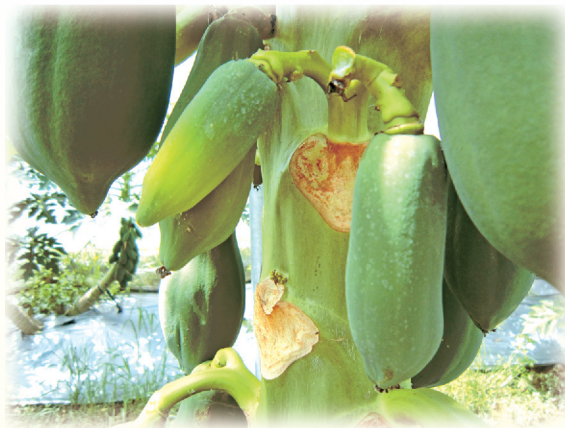
▲圖13. 授粉不良果實無法正常增大

夏季的高溫多雨氣候，經常發生木瓜果實無法發育的小果現象(圖13)，果實內很少或甚至沒有種籽，顯示小果的現象可能與果實無法順利授粉有關。但是造成小果的原因，目前尚屬不明，因此其解決方法仍需加以驗證。目前建議可將授粉不良小果，於著果初期儘早割除，使養分得以分配到其他部位，以減輕小果問題。