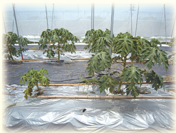
▲圖8. 左植株為傳統覆蓋，右植株以泰維克布替代覆蓋。