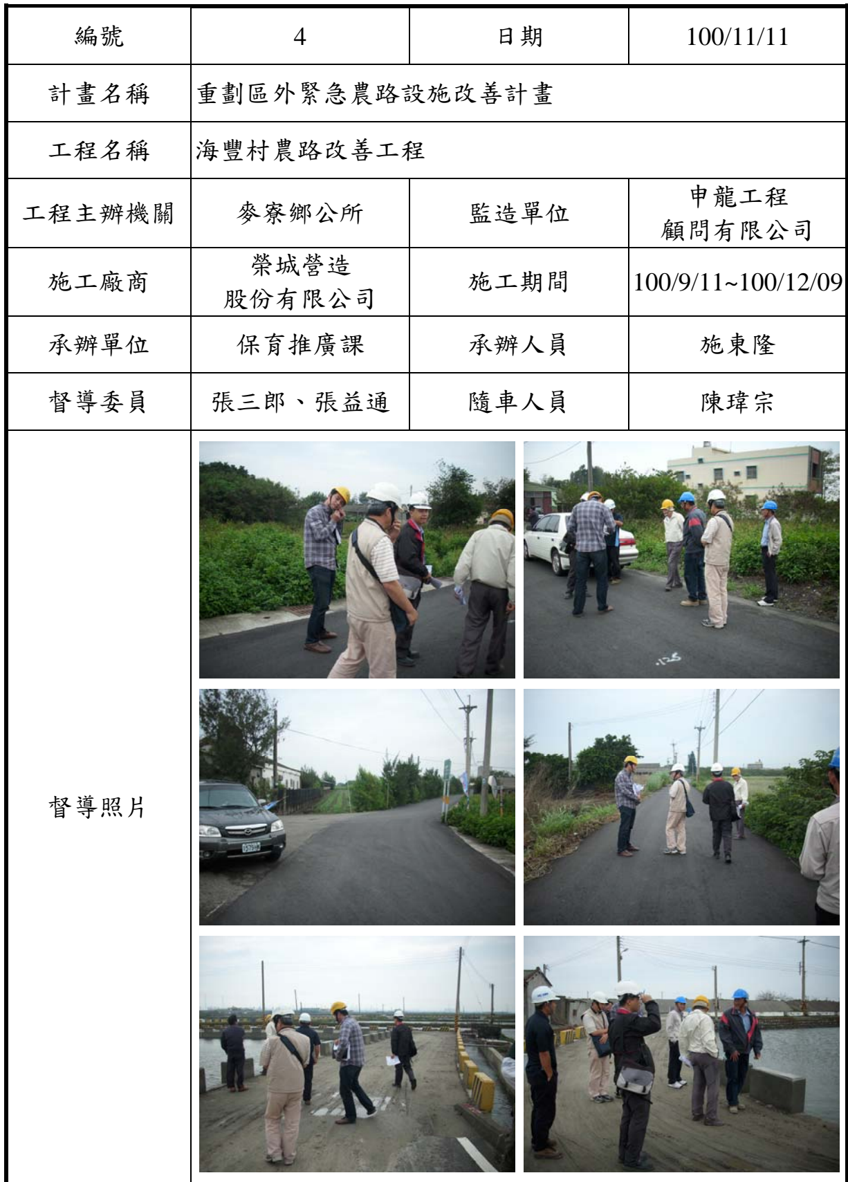
表 7-4 協助辦理工程督導一覽表 (4/4)