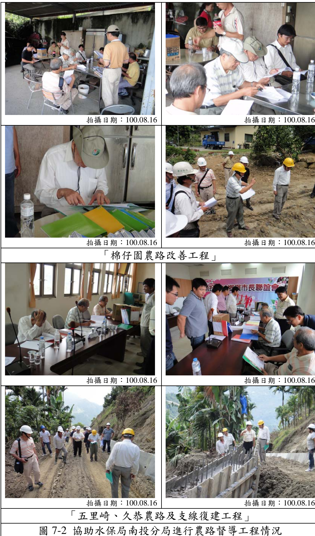
圖 7-2 協助水保局南投分局進行農路督導工程情況