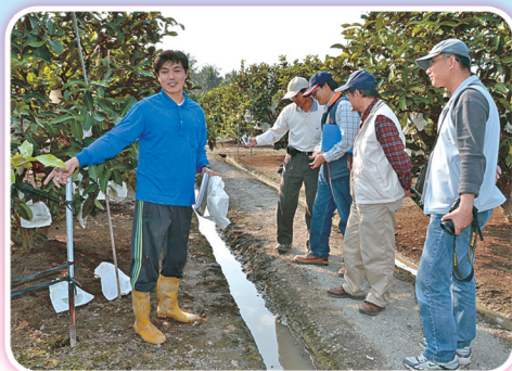
蓮霧優質管理果園田間審查情形