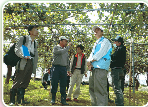
棗子優質管理果園田間審查情形