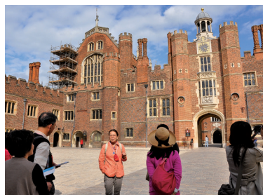
英國倫敦漢普頓宮旅英台籍解說員的解說

至目前為止，國內的資源管理單位，如國家公園、林務局、觀光局等隨著時代的需求，都在加強環境教育活動，而動植物園、科學教育館、海洋生態博物館等單位也相當重視環境解說之推動，他們均接受外界的預定，安排解說志工，解說自然文化資源的特性與價值，相當受到遊客之好評，由於不收費，又比一般旅行社之導覽更有內涵，對該解說單位的形象有相當的提升效果，但遊客也視解說是應該的服務，久而久之，缺乏上進的誘因，解說的內涵一直停留在一定的程度也屬自然。因為是志工不得收費，比起先進國家是解說付費之模式不同，除了非常愛好自然文化的優秀志工，並將解說視為濃厚的興趣，否則更進一步提升內涵的誘因自然不足，這是國內公營解說系統面臨的共同困境。