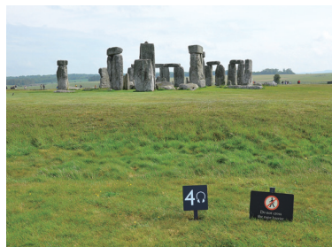
英國古巨石群的自導式解說