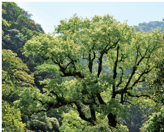
台灣是樟樹的王國

驚奇，這種自然造物之神奇，唯有台灣特殊之氣候、地形才有這樣之功力營造雕刻出來吧！