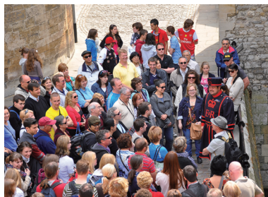
英國倫敦塔穿制服的環境解說