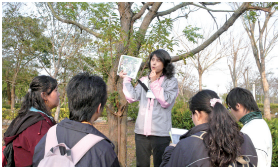
環境解說是說精采獨特的故事

取而代之的是對人、事、時、地、物之認識與觀察，透過故事之詮釋，人文、景物、生態等之呈現。聰明解說人員運用口語傳達技巧，配合現場空間之景物或展示，有趣的、詼諧的、深入淺出的說出精采之故事。基本上解說是綜合人文、歷史、科學、藝術、生態、美學等多元意涵之表達，解說本身並非易事，它需要強化溝通技巧，需要經常練習，培養成博學多聞則是解說員之最高境界。