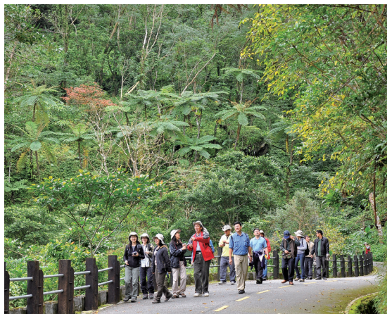
台灣筆筒樹在全球具有獨特的地位

成為優秀的解說人員非一朝一夕之事，要成為卓越的解說人員更是需要下紮實的工夫，包括有目標的閱讀與發揮敏銳的觀察力。筆者這些年長跑國外，比較熱衷於觀摩世界遺產，因為它們雀屏中選，總是事出有因。而每個世界遺產總是帶有精采的故事在內，不管是自導式的解說，或現場的導引，華人導遊總是由台灣至當地的留學生或旅居該國的台灣人擔綱，偶而也有來台留學歸國的當地人解說，感覺上台灣人在國外的解說人員素質都是第一流的，當然收費也不低。好的旅行團與差的旅行團除