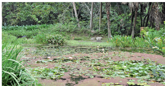
全方位的濕地解說包含濕生演替的過程

植物與動物的關係牽涉食物鏈的循環，是環境教育上極重要的一環，雖有部分資料越來越明朗，可惜運用不多，是目前亟待突破的部分，也唯有此部分有進展，才有機會進入綜合環境的整體論述，而也唯有將植物、動物、環境與人一起納入解說，才會有關懷環境的舉動與習慣。