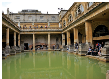
英國巴斯古羅馬浴池的自導式解說人手一機