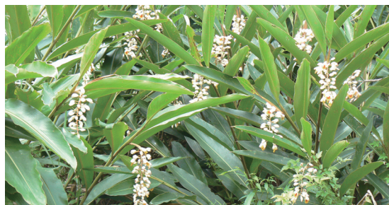
引起興趣的解說民俗植物月桃是重要的材料

台灣的土石流相當嚴重，低海拔的河床幾乎都已水泥化，不僅過度開發，一般人對溪流環境的認識有極大的偏差，多數人認為水泥堤防是最好的，從沒有溪流生態系的概念，對溪邊的植群、石頭，以及周邊的森林的價值均無概念。有關森林涵養水源、攔止土砂其實是環境教育上一個重要課題。如森林都是樹，果樹、檳榔也是樹，到底功能有何區別？森林多層次的結構、地被族群、樹根、苔蘚、蕨類、枯立倒木、腐植質層在涵養水源與攔止土砂扮演怎樣的地位？又洪峰流量與洪峰到達速度，