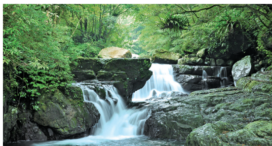
森林為何涵養豐富的水源是重要的解說題材

全方位之解說關心鄉土，也關心全人類與地球之未來。因此適度引用現有材料，加入環境之認識與物種面臨之威脅都是好的設計，如在森林裡解說野鳥，可以說野鳥與森林之故事，這是全面認識野鳥之開始，比每種野鳥外觀之辨識更形重要，而介紹野鳥面臨的威脅，可以讓遊客產生關懷，甚至激發具體之保育行動。