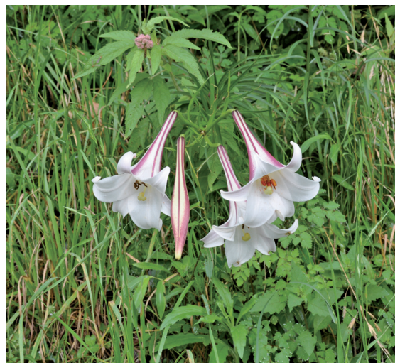
民俗植物台灣百合有許多精采的故事

台灣百合的花之中肋外面紅褐色，這是與麝香百合之純白花最大之區別點。花長約15公分，內具6枚黃褐色之雄蕊與1枚淡綠色之雌蕊，花芳香。在野外盛開時，棵棵亭亭玉立，風吹拂帶來濃濃香氣，令人陶醉。其圓柱型之蒴果成熟時裂開，散出許多薄翅扁平狀之種子，種子數量數百至上千，平均約1千顆。