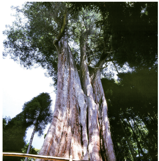
因生育於特殊的地理條件，台灣的紅檜巨木外貌極為特殊。

由於過去數百年之伐木史，美日檜木之天然林已不多見，咸信加拿大西海岸之阿拉斯加檜仍有天然林，但因其種子不孕性高，更新較困難。相對而言，台灣之檜木，雖然日治時代及政府來台初期砍伐頗多，但因高山險峻、交通不便，仍有一大半之檜木天然林被保存下來，而且從其分布看來更新尚無困難，目前台灣中海拔之造林亦以檜木為主，因此檜木在台灣之山區仍然欣欣向榮。更可貴的是許多檜木今天以巨木群的型態展現，這是美、日等國無法比擬的。