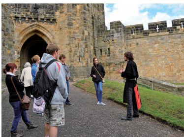
英國亞倫維克古堡穿制服的解說