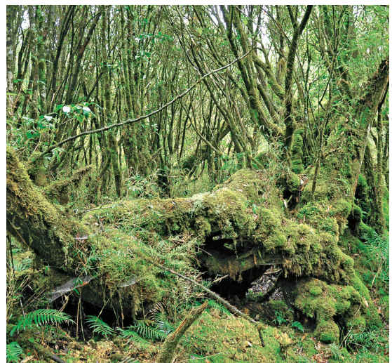
進入原始森林，此時無聲勝有聲。