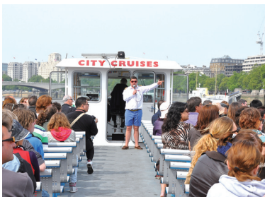
英國泰晤士河遊艇之旅的環境解說