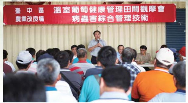
▲「溫室葡萄病蟲害綜合管理技術」田間觀摩會於彰化縣溪湖鎮葡萄專區舉辦，農友熱烈參與

共分3階段，第一個時期自清園至萌芽：修剪葡萄枝條、清除殘體，並進行全面消毒。第二個時期自萌芽至開花：依植物保護手冊推薦之藥劑，進行3-6次防治，使園區病蟲害無法立足。第三個時期自開花至採收：視病蟲害種類及發生密度，應用非農藥資材防治，所用資材包含亞磷酸、碳酸氫鉀及蘇力菌等。此外，於栽培全期配合懸掛黃色黏紙監測及誘殺小型害蟲，並利用性費洛蒙誘殺零星侵入之斜紋夜蛾及甜菜夜蛾。利用此技術僅於葡萄栽培全期使用3-6次化學農藥防治病蟲害，與一般農民慣行管理方式（約施藥15次）相比，可大幅減少6至8成的施藥次數，除降低生產成本外，更能顯著提高鮮食葡萄之安全性，確保消費者健康並提昇消費意願，共創農民、消費者、生產環境的三贏局面。