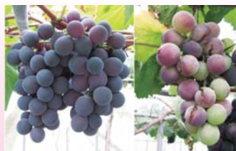
▲左：應用新技術之葡萄品質優良 右：一般栽培方式罹患白粉病