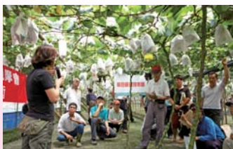
▲本場研究人員於田間觀摩示範區向農友說明本項技術內容

共分3階段，第一個時期自清園至萌芽：修剪葡萄枝條、清除殘體，並進行全面消毒。第二個時期自萌芽至開花：依植物保護手冊推薦之藥劑，進行3-6次防治，使園區病蟲害無法立足。第三個時期自開花至採收：視病蟲害種類及發生密度，應用非農藥資材防治，所用資材包含亞磷酸、碳酸氫鉀及蘇力菌等。此外，於栽培全期配合懸掛黃色黏紙監測及誘殺小型害蟲，並利用性費洛蒙誘殺零星侵入之斜紋夜蛾及甜菜夜蛾。利用此技術僅於葡萄栽培全期使用3-6次化學農藥防治病蟲害，與一般農民慣行管理方式（約施藥15次）相比，可大幅減少6至8成的施藥次數，除降低生產成本外，更能顯著提高鮮食葡萄之安全性，確保消費者健康並提昇消費意願，共創農民、消費者、生產環境的三贏局面。