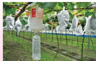
▲本技術於田間懸掛性費洛蒙誘殺斜紋夜蛾及甜菜夜蛾，降低農藥使用量