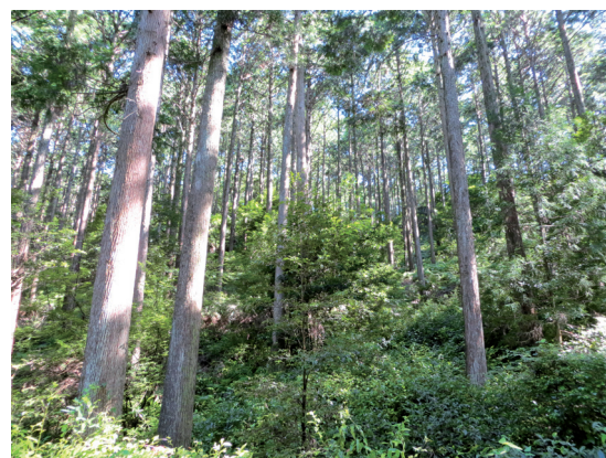
照片2 適當的疏伐可促進林地更新及多樣性

比較同時提交造林、再造林(AR)及森林經營(FM)數值的國家，可看出各國森林經營(FM)的淨溫室氣體量明顯高於造林、再造林(AR)，後者的淨溫室氣體量有限且遠不及進行前者的效果，以烏克蘭的AR/FM比例最低為0.07%，而匈牙利AR/FM比例最高為52.29%，日本則僅0.83%，其整體平均僅為森林經營(FM)的7.18%。以碳吸存的角度來看，藉由造林雖可增加碳吸存量，但森林經營所產生的碳匯效益更是重要。另外，由於造林、再造林(AR)需有一定的土地資源來進行植林作業，同時其造林和皆伐作業的成本皆較高，與森林經營(FM)相較之下所受的限制較多。未來森林經營活動的淨溫室氣體量將為附件一國家達成減碳目標的重要籌碼。在第一承諾期，為避免各國過度利用森林經營的碳匯效益而設定各國的上限額度。但隨