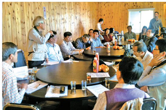
2012年3月4日召開新竹縣永泰林業生產合作社發起人暨第一次籌備會議情形

2012在此期間筆者與籌備會工作人員接觸頻繁，協助他們撰寫章程草案與業務計畫書，並實際參與撰寫或修改其內容，希望能適用於未來實際業務推動。經過長久的努力，終於於2012年3月4日召開發起人暨第一次籌備會議，會中並蒙林務局長官蒞臨指導，讓與會的林農們倍感鼓舞(圖2)：