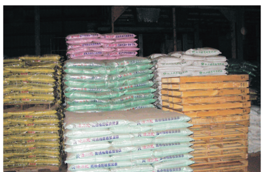
圖2.施用符合安全的肥料，可確保玉荷包荔枝生產之健康安全。