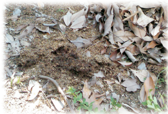
圖1. 果園施用大量雞糞後，常含高量重金屬，安全性堪虞。

未經腐熟的禽畜糞便(圖1)，往往含有高量的重金屬(如銅及鋅等)，長期施用易累積於土壤，進而經由吸收而進入樹體內；另外，自製堆肥應注意原料來源，如選用禽畜糞或工廠副產物製作有機肥，需了解原料中是否含有害物質，以確保施用後不影響土壤性質及生產的安全性。農友在選購肥料時，應選擇政府核可，登記有案之肥料來施用(圖2)，目前國產有機質肥料之推薦名單，可至農糧署網站( http://www.afa.gov.tw/ )中查詢。