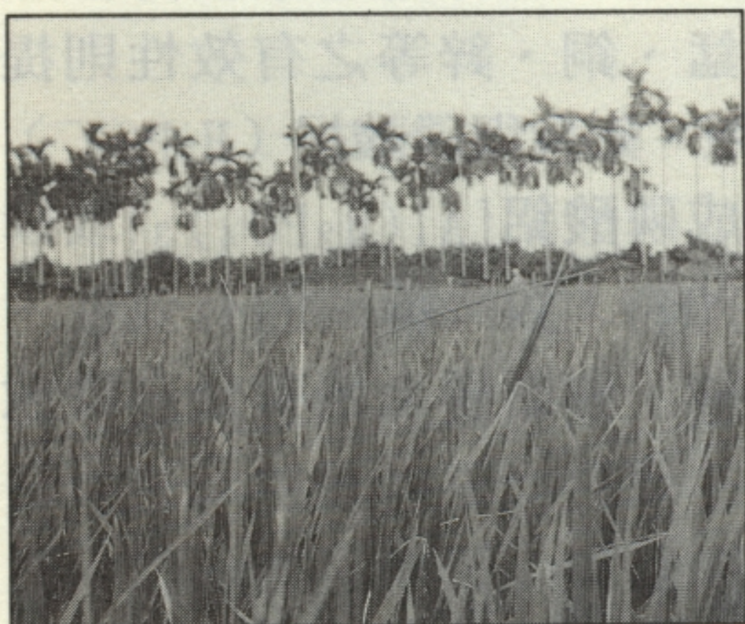
稻苗徒長病株較正常者高