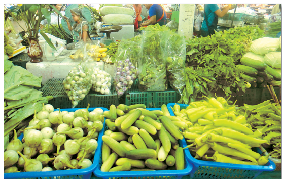
圖5. 東南亞市場常見的小胡瓜的果型(中)