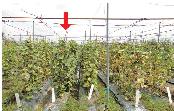
圖3. 高溫期田間生長表現KSF110(箭頭處)品系優於其他品系