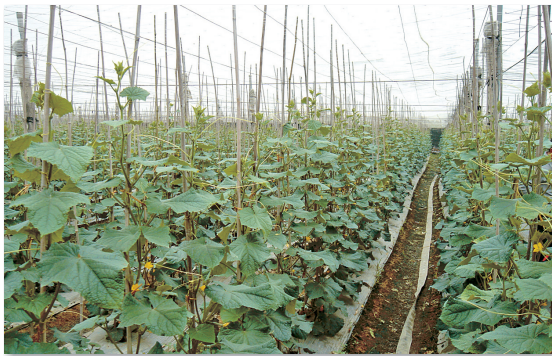
① 圖1. 高屏地區常見的小胡瓜網室設施栽培

高雄市和屏東縣是國內小胡瓜重要產地，占全國生產面積50%～79%。高屏地區夏季炎熱多雨，全年最高溫度為6～9月，雨季集中在5～9月，又本地區栽種以網室設施栽培居多(圖1)，室內溫度常