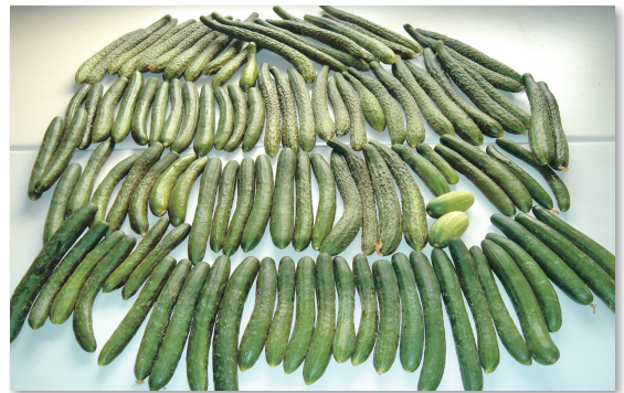
② 圖2. 果型多樣化的小胡瓜種原

目前蒐集國內外商業品種共100多種，除台灣的品種外，還有來自美國、日本及巴西等8個國家(圖2)。歷經一連串種原後代的夏季選拔與自交系統純化工作，並將符合選拔目標的優良自交系，依據性狀的遺傳特性再進行雜交，成為生長勢強、外表表現一致的雜交一代品系，並在夏季高溫時種植篩選，希望能選出高溫障礙少，適合夏季生產小胡瓜品種。