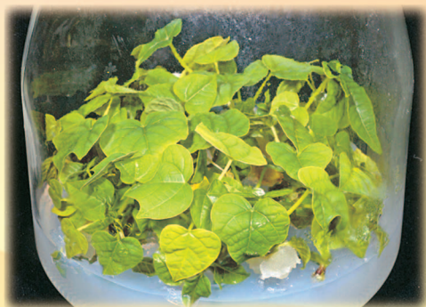
技術移轉後生產的木瓜組織培養瓶苗