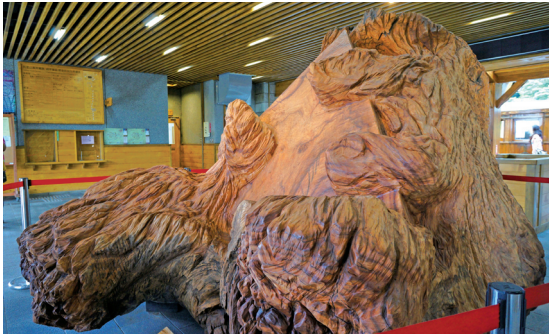
山、水、人一守護阿里山，守護台灣

護阿里山，守護台灣」，表達阿里山精神是闡述人對自然敬畏之意念；樹幹創作主題為「森林的記憶」，表達作者對「樹」的體驗及提出對木材質的詮釋。作品於沼平車站1樓及2樓的空間長期展出，與車站全新的樣貌相互呼應，不僅為森林鐵路車站注入藝術與人文氣息，更帶領台灣林業文化走入另一境界，誠摯邀您前往享受一趟自然與藝術人文的山中之旅。🌲