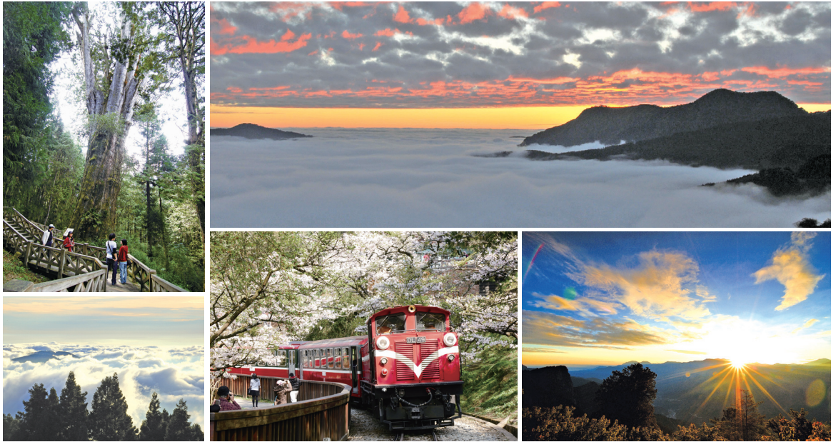
五奇—神木、日出、雲海、晚霞、鐵路