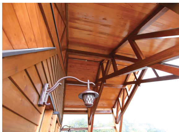
採用榫接的桁條斜撐接合工法

為致力打造「沼平車站」成為國際級的高山觀光景點，林務局嘉義林區管理處特別邀請國際木雕藝術家齊聚嘉義，展開現場漂流木創作。其中由台日木雕藝術家雕刻的二件大型牛樟藝術品，樹頭創作主題為「山、水、人—守