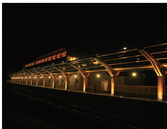
沼平車站的夜間照明亮