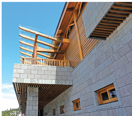
外觀天然硬質砂岩牆面