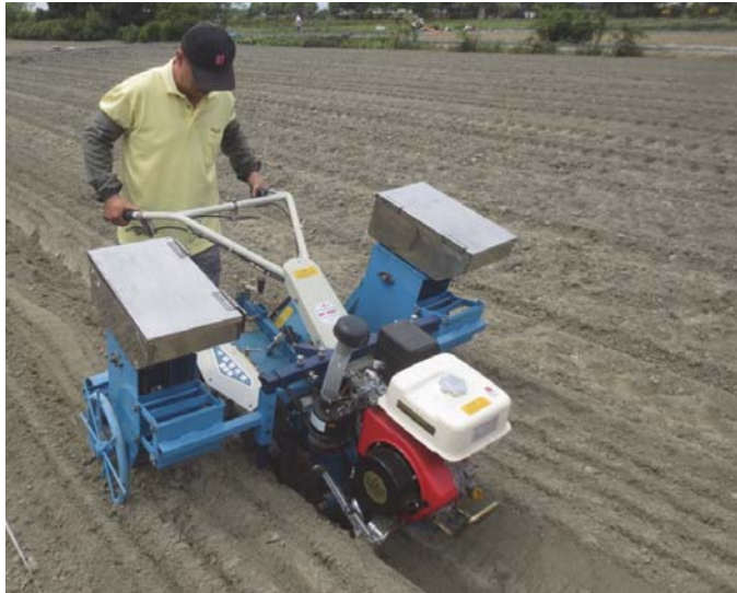
圖三、中耕管理機附掛蓖麻播種機械之田間作業情況 Fig. 3. The Castor Seeder Working on The Farm

式及改變播種輪孔穴方式予以提升，另針對作業人員田間操作舒適性，可針對單座播種機械進行重量減輕，以及整機重量分配方式，提高作業人員田間操作負重，使蓖麻播種機械作業功能更趨於完善。