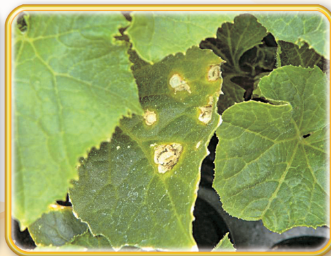
圖 2. 胡瓜苗白枯病

感染 Pseudomonas viridiflava 的胡瓜植株，葉片產生黃暈斑點，中心白色，葉緣水浸狀後褐化，葉片壞疽枯萎。