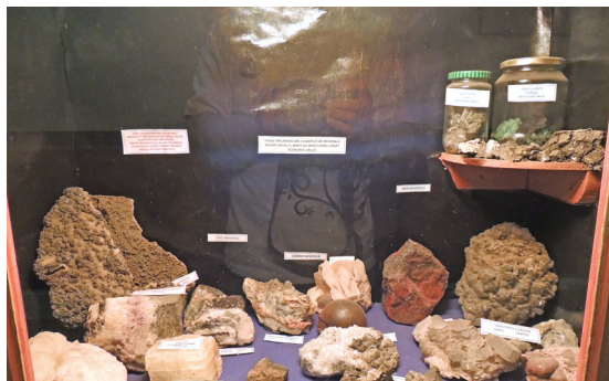
中心除了生物相關課程之外，地質方面更是其特色之一。

邊環境維護的5名人力，協助進行庭院綠美化、教學場域維護等工作。中心大部分教師皆非本地人，但行政人員、主廚及其他工作人員皆聘用當地居民。雷迪克雷艾中心提供2名生實習生的機會，歷年實習生人數皆由中心主任決定。