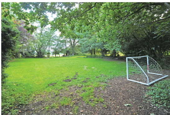
認真上課後也需要能活動筋骨的休閒空間