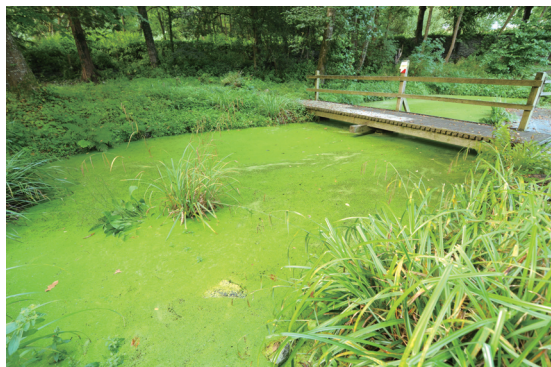
綠意盎然的生態池，是個教授水域生態系的好地方。