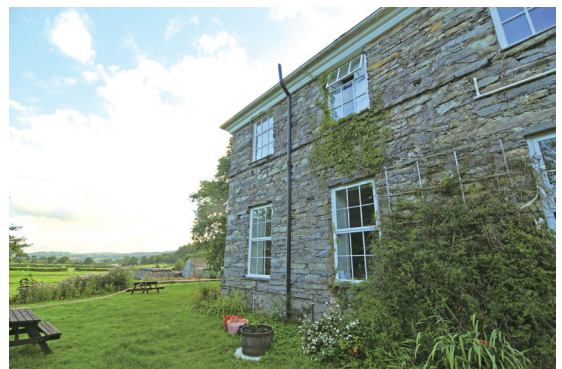
Rhyd-y-Creiau中心是個隨時讓來訪者感受到「改變」的地方