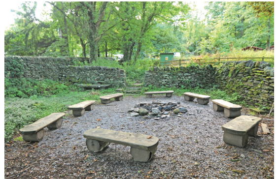
營火場地可以在黑夜之中凝聚彼此的向心力