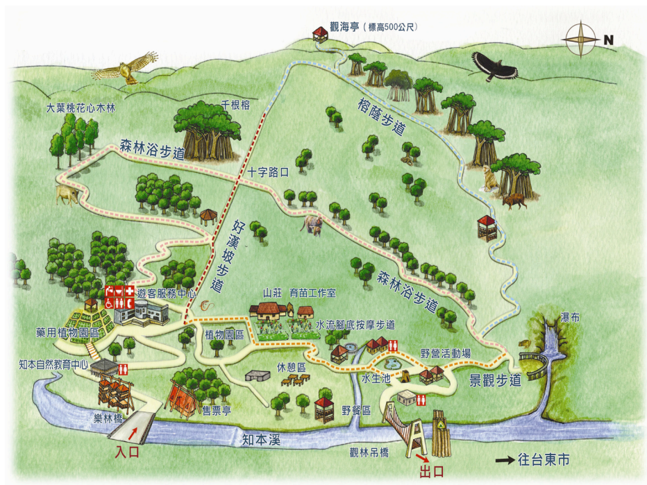
圖3 知本森林遊樂區全區路線圖